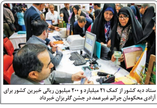
آزاده دیه کشور از کمک ۲۱ میلیارد و ۳۰۰ میلیون ریالی خیرین کشور برای آزاد کردن محکومان جرائم غیرعمد در جشن گلریزان خبر داد