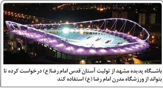
باشگاه پدیده مشهد از تولیت آستان قدس امام رضا (ع) درخواست کرده تا بتواند از ورزشگاه مدرن امام رضا (ع) استفاده کند