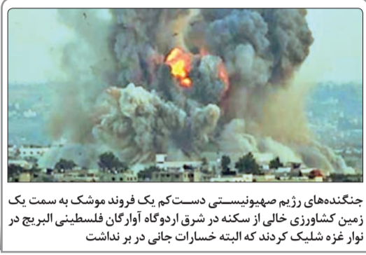
جنگنده‌های رژیم صهیونیستی دست‌کم یک فروند موشک به سمت یک زمین کشاورزی خالی از سکنه در شرق اردوگاه آوارگان فلسطینی البریج در نوار غزه شلیک کردند که البته خسارات جانی در بر نداشت

◀ وزارت خارجه آمریکا وجود هرگونه تنش در روابط با عربستان در نتیجه مخالفت ریاض با موضع واشنگتن درباره سوریه را تکذیب کرد. ◀ به دنبال تعلیق فعالیت‌های جمعیت الوفاق بحریں، بزرگ‌ترین جمعیت شیعه مخالف در این کشور از سوی دادگاه و بسته شدن مقرهایش، دادستانی کل بحرین دو جمعیت مخالف دیگر به نام‌های الرساله و التوحیه الاسلامیه (آگاهی اسلامی) را نیز منحل کرد.