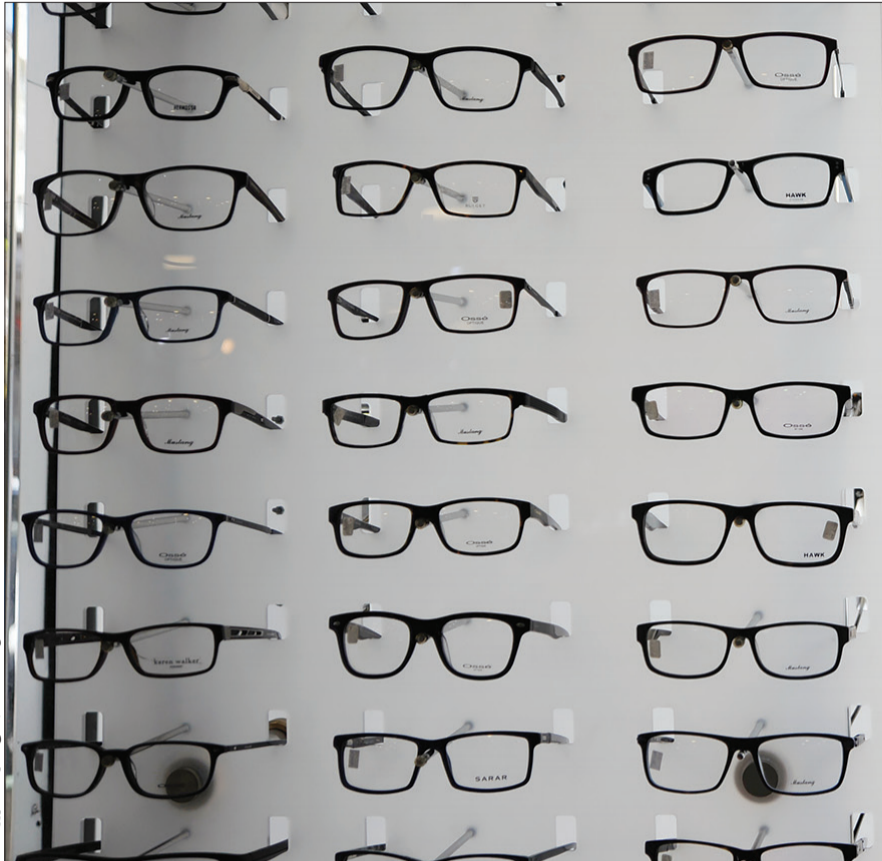
عینک‌ها، سیمه سه‌پایه | از دست امروز

ضمناً جنس لوکس و بسیار گرانبه‌قیمت هم هست که به مشتریان خاص تعلق دارد و به صورت سفارشی از دوی یا استانبول در بسته‌بندی مخصوص می‌آورند (مانند ست عروس و داماد) که تا ۴ میلیون تومان برای خریدار آب می‌خورد. در این منطقه برندهای معروف و قدیمی عرضه می‌شوند. مشهورترین آنها عبارتند از: ری، جورجیا، کودینی، پلازا، لاپونیت، دیورا، کریستین، گوچی، پرسول، دی‌اندی، ورساچی، فندی، چوپارد و فینسا. در ضمن عدسی‌های موجود هم بیشتر از ۳ مارک عمده است: زایس و رودن‌اشتوک (آلمان) و اسی‌لور (فرانسه). برندهای ژاپنی، کراهی و تایوانی هم پیدا می‌شوند.