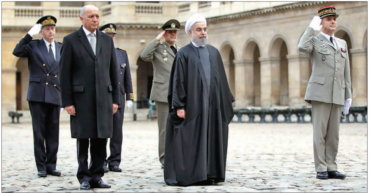
علی اصغر جمعه‌ای:

بود که این سفرها و قراردادهای منعقد شده صرفاً به مثابه استراتژیک و جرقه‌ای برای آغاز رابطه بوده و نمی‌توان آن را به معنای دستاورد بزرگی برای کشورمان قلمداد کرد. در عین حال برخی دیگر معتقدند که این سفرها و قراردادهای دستاوردهای بسیار خوبی را برای اقتصاد کشورمان خواهد داشت. هر چند که نباید انتظار داشت که نتایج این موضوع در کوتاه‌مدت و در سال آینده