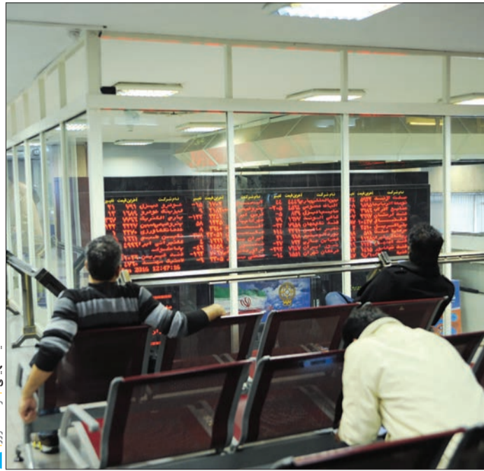
سهام‌های گروه بانک طی معاملات روز گذشته در حالی با استقبال فعالان بازار سهام همراه شد که اغلب سهام شرکت‌ها در گروه‌های مختلف همچون ایران خودرو، روند منفی را سپری کردند. در پایان معاملات، شرکت اعتباری کوثر مرکزی، بانک پارسیان و بانک اقتصاد نوین تنها نمادهای منفی گروه بودند. بست بانک ایران، بانک حکمت ایرانیان و بانک ملت نیز معاملات را با صف خرید به پایان رساندند. معاملات گروه بسیار پرچم بود به طوری که با معامله ۴۹۱ میلیون سهم وبملت و بانک صادرات ایران بیشترین حجم معاملات را در گروه خود اختصاص داد. بازم نکته منفی گروه بانک در معاملات دیروز، فروش

شاخص کل بورس و اوراق بهادار در معاملات روز شنبه با ۳۲۹ واحد افت به ارتفاع ۷۷ هزار و ۵۵۸ واحدی عقب‌نشینی کرد. بورس تهران بعد از ثبت یک ماه رویایی در بهمن، در نخستین روز اسفندماه روند نزولی در پیش گرفت به طوری که انتظار سهامداران برای ارائه گزارش‌های بودجه سال آینده اندکی از شدت روند صعودی بورس کاست. از سوی دیگر پیش‌بینی می‌شود سهامداران پس از پشت سر گذاشتن روزهای آینده از بابت ارائه گزارش‌های بودجه‌ای شرکت‌ها، شاهد عبور پرقدردن نامگرهای بورس از رکوردهای از دست رفته خود باشند. با این همه، شرایط فعلی بازار بهترین فرصت برای خریداران جامانده برای خرید سهم‌های برخوردار از چشم‌انداز بنیادی قوی است. هرچند که این روزها نوسان‌گیران حضور در تک سهم‌ها را به دست‌نهایی ترجیح می‌دهد. روز گذشته با وجود روند نزولی قیمت سهام شرکت‌ها، نمادهای گروه بانکی با اقبال مواجه شدند و از میان شرکت‌های خودرویی، سهام سایپا توانست به دلیل عرضه بلوکی پیش رو، روند مثبت خود را حفظ کند. روز گذشته همچنین شرکت تازه‌وارد پتروشیمی فجر عرضه شد، بیشترین تقاضای بازار را به خود اختصاص داد و با برخورداری از صف خرید ۲۰۰ میلیونی در صدر سایر شرکت‌ها ایستاد. در بازار روز شنبه با وجود منفی شدن قیمت‌ها و شاخص بورس، اما دادوستد سهم پرچم بود و افزایش قابل توجهی پیدا کرد به طوری که در مجموع بیش از ۳۳۰۰ میلیارد سهم به ارزش ۷۸۴ میلیارد تومان دادوستد