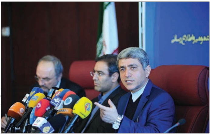
شاپور محمدی، وزیر اقتصاد و دارایی، در نشست خبری

نرخ رشد سرمایه‌گذاری در سال‌های ۹۱ و ۹۲ منفی شده بود و نرخ رشد اقتصادی نیز در سال ۱۳۹۱ معادل ۶.۹- درصد بود در سال ۹۳ مثبت شد و به ۲.۵ درصد رسید، اظهار کرد: میانگین تورم سالانه که در مهرماه ۹۲ به بالای ۴۰ درصد رسیده بود، روند نزولی در پیش گرفت و در نهایت در دی‌ماه سال جاری به ۱۳.۲ درصد رسید و تورم نقطه به نقطه که به ۴.۴ درصد رسیده بود، برای نخستین بار در آذر ماه