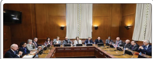
استفان دی میستورا، فرستاده سازمان ملل در سوریه به هیأت اعزامی دولت سوریه در ژنو دیدار و گفت‌وگو کرد

خود در محافظت از کشور عمل می‌کنند. اداره بررسی‌های مالی در وزارت کشور عربستان بیشتر اعلام کرده بود که در سال ۲۰۱۴ بلاغیهایی به این وزارتخانه ارسال شده بود مبنی بر اینکه اقداماتی درباره پولشویی و حمایت مالی از تروریسم در این کشور صورت گرفته و ۸۸ درصد ابلاغیه‌ها مربوط به حمایت مالی از تروریسم بوده است. پیشتر وزیر اقتصاد آلمان نیز به عربستان نسبت به حمایت مالی از گروه‌های تندرو در آلمان هشدار داده بود. در گزارشات فاش شده از سوی وب‌سایت افشاگر ویکی‌لیکس نیز آمده بود که هیلاری کلینتون، وزیر خارجه سابق آمریکا در سال‌های ۲۰۱۰ و ۲۰۱۱ گفته بود که عربستان از گروه‌های تندرو حمایت مالی به عمل می‌آورد.