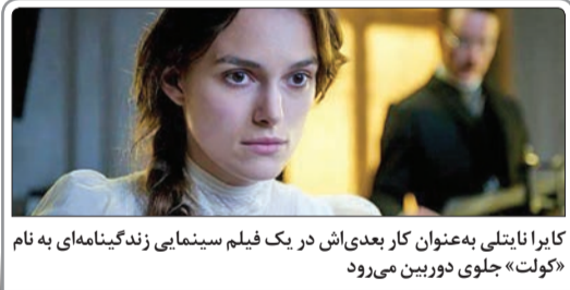
کایرا نایتلی به‌عنوان کار بعدی‌اش در یک فیلم سینمایی زندگی‌نامه‌ای به نام «کولت» جلوی دوربین می‌رود