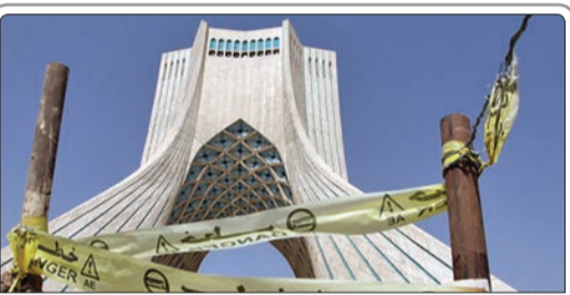
احمدحکیمی‌پور، رئیس کمیته میراث فرهنگی شورای شهر تهران گفت: قرار بود ساماندهی برج آزادی تا دی‌ماه به اتمام برسد که همچنان پل‌تاکلیف است