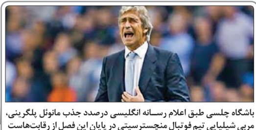
باشگاه چلسی طبق اعلام رسانه انگلیسی درصد جذب مانوئل پلگرینی، مربی شیلیایی تیم فوتبال منچستر سیتی در پایان این فصل از رقابت‌هاست