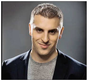
برایان چسکی (Brian Chesky)

برایان چسکی کارآفرین اینترنتی، موسس ایربی‌ان‌بی (Airbnb) به همراه جو گیبا (Joe Gebbia) و مدیرعامل این استارت‌آپ است. ایربی‌ان‌بی یک وب‌سایت است که کاربران آن می‌توانند خانه، هتل و محل‌های موردنظرشان برای اقامت در هنگام مسافرت را در این سایت پیدا و اجاره کنند. در واقع این وب‌سایت یک شبکه اجتماعی است که کاربران بدون نیاز به مبادله ارزی می‌توانند مکان موردنظرشان را اجاره کنند. همچنین این وب‌سایت فهرستی با بیش از ۱۵۰۰۰۰ مورد اجاره‌ای در ۲۴ هزار شهر و ۱۹۰ کشور جهان دارد. چسکی و جو گیبا در سال ۲۰۰۸ زمانی که هر دویشان به سان‌فرانسیسکو نقل‌مکان کردند، هم‌اتاقی شدند. در حالی که هر دو بیکار بودند و به پول نیاز داشتند، قرار بود کنفرانسی در زمینه طراحی صنعتی برگزار شود و ظرفیت بسیاری از هتل‌ها تکمیل شده بود. این دو، این دو نفر تصمیم گرفتند با اجاره دادن محل زندگی‌شان درآمدی کسب کنند. آنها سه تشک بادی خریدند و با ساختن یک وب‌سایت ایده‌شان را تخته‌خواب و صبحانه «Air Bed and Breakfast» نامیدند و این گونه بود که ایربی‌ان‌بی ماسیس شد. نیتن بلکرچک (Nathan Blecha) فارغ‌التحصیل دانشگاه هاروارد هم در فوریه ۲۰۰۸ به‌عنوان سومین موسس این وب‌سایت به آنها پیوست.