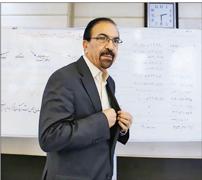
رئیس شورای رقابت