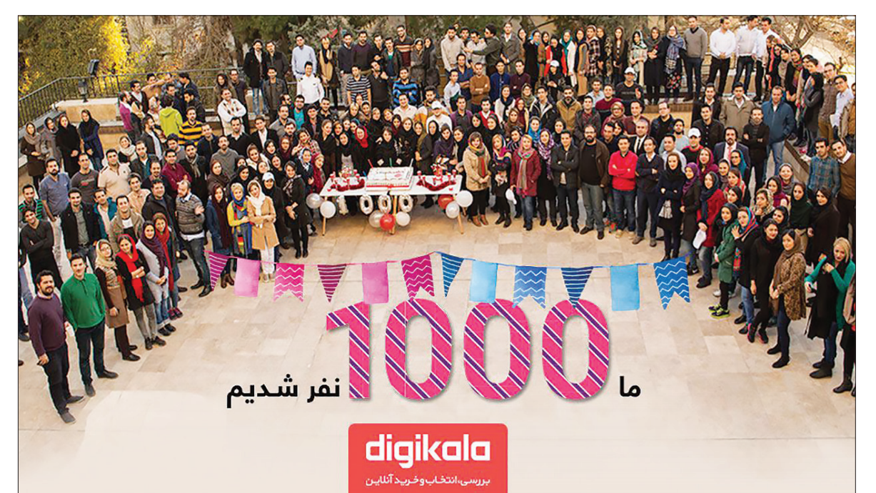
ما 10000 نفر شدیم digikala بررسی، انتخاب و خرید آنلاین