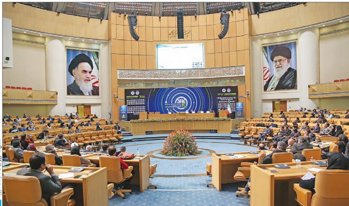
عکس‌ها از سایت فورس‌نت امروز