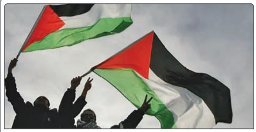
پارلمان یونان، روز سه شنبه با تصویب قطعنامه‌ای کشور فلسطین را به رسمیت شناخت

◀ سیدحسن نصرالله، دبیرکل حزب‌الله لبنان در سخنرانی خود به مناسبت شهادت سمیر قنطار اعلام کرد: خون قنطار و تمام شهدا به ما این پیام را می‌رساند که پرچم مقاومت هرگز بر زمین نمی‌افتد. ▶ جنبش اسلامی نیجر به اعلام کرد، دهها نفر از شیعیان این کشور که در جریان حملات از تش مجروح شده‌اند به دلیل عدم رسیدگی پزشکی در زندان‌های ارتش و پلیس وضعیت اسفباری دارند و تاکنون چند نفر از آنها به شهادت رسیده‌اند.