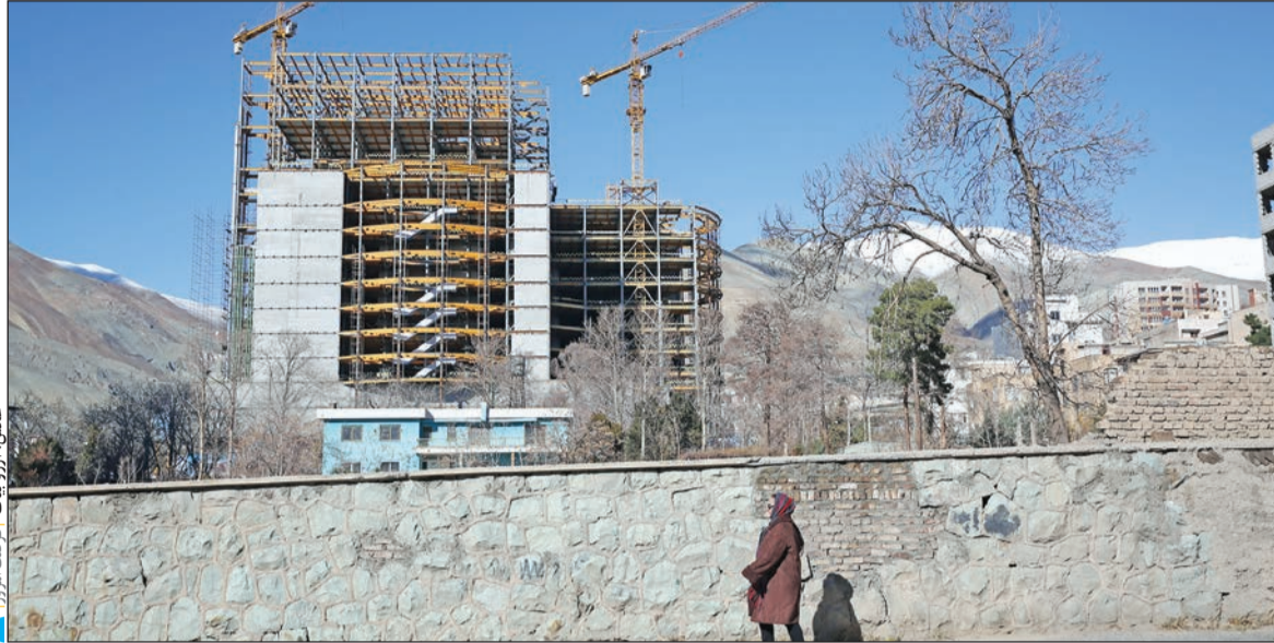
عمران آخوندی در بازدید از پروژه مسکن قسطی