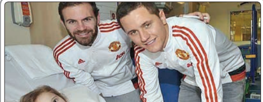
بازیکنان تیم فوتبال منچستر یونایتد به رسم سنت هر ساله در بیمارستان رویال کودکان شهر منچستر حضور یافتند و با کودکان بیمار و خانواده‌های آنان دیدار کردند

۱۸ دسامبر گرفته شده است و به نظر حکم جدیدی نیست. باید بگویم چنین حکمی به هیچ وجه مرا غافلگیر نکرد و به خوبی می‌دانستم که آنها چه تصمیماتی گرفته‌اند. به این حکم اعتراض دارم و تا آخرین لحظه از حق دفاع می‌کنم. پرونده را به دادگاه عالی ورزش می‌کشام و منتظر رأی بعدی خواهم ماند. در چند هفته اخیر، بسیار آذیت شدم و روزهای سختی را پشت‌سر گذاشتم اما ناامید نمی‌شوم و به تلاش ادامه می‌دهم.