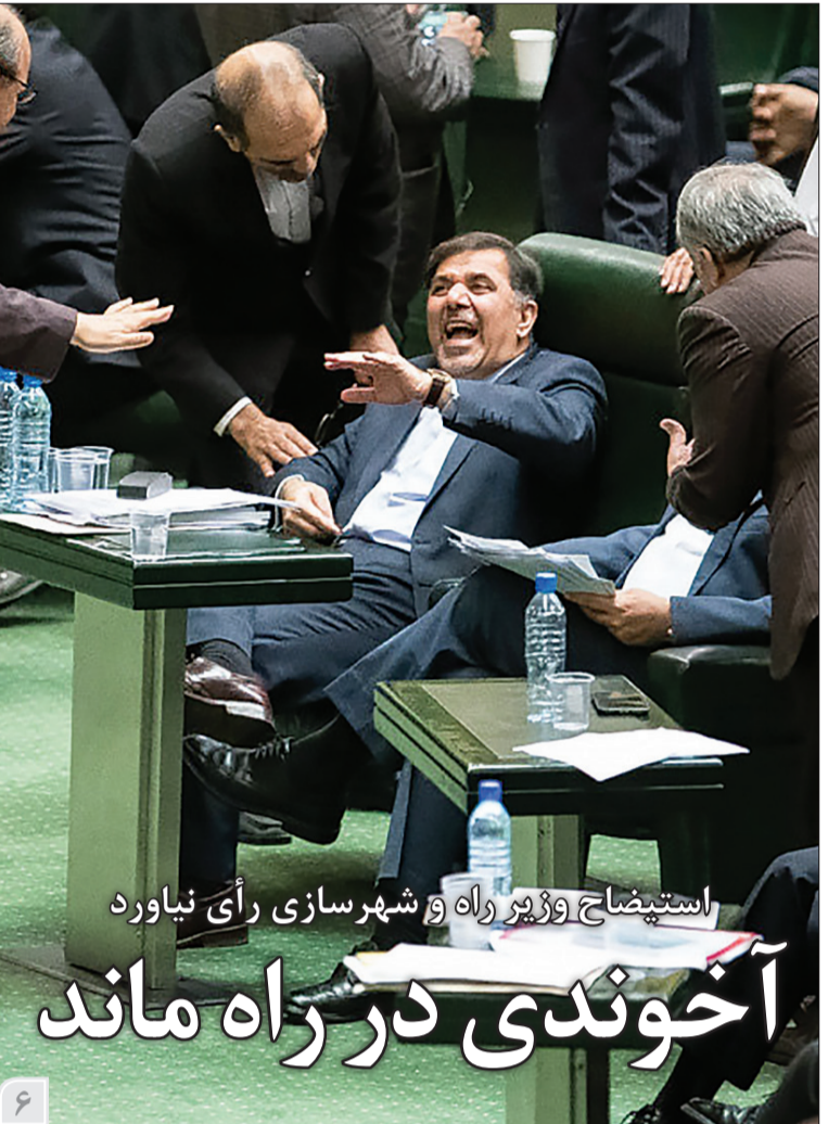
استیضاح وزیر راه و شهرسازی رأی نیاورد