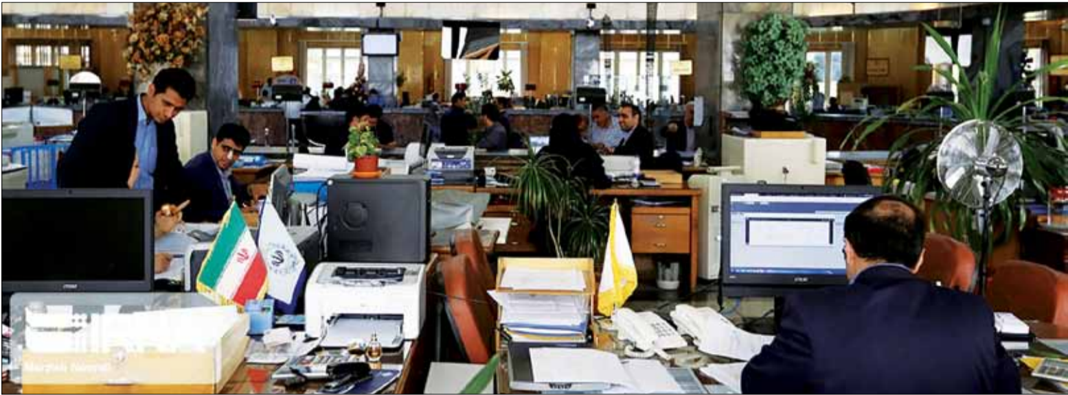
دیدار مدیرعامل بانک سپه با مدیر عامل بانک کشاورزی

ضرب شاخص‌های مختلف توسعه نظام پرداخت بر رشد اقتصادی تمرکز کرد. با توجه به اینکه این موضوع نیازمند معرفی شاخص‌های توسعه نظام پرداخت است، بنابراین ابتدا باید به معرفی این مفهوم پرداخت. نظام پرداخت در یک تعریف وسیع شامل چهار جزء است. اولین جزء به مباحث قانونی و مقرراتی این نظام مربوط می‌شود. یکی از موضوعات مهم در این بخش از نظام پرداخت آن است که مفاهیم حقوقی به اندازه کافی توسط چارچوب‌های قانونی پوشش داده شوند. دومین جزء در نظام پرداخت سیستم‌های پرداخت کلان یا عمده است. در این سیستم‌ها، با توجه به تعریف بانک تسویه بین‌المللی انتقال‌هایی صورت می‌گیرد که ارزش و اولویت بالایی دارد. اولین موضوع به ریسک نقدینگی مربوط می‌شود. در اینجا منابع تامین وجود نقد بااهمیت است. سومین جزء در نظام پرداخت را سیستم‌های پرداخت خرد تشکیل می‌دهد. اولین موضوع در تعیین سطح توسعه‌یافتگی این جزء به ویژگی‌های اتاق تسویه چک و زیرساخت‌های اتاق تسویه خودکار مربوط می‌شود. چهارمین جزء نیز به بحث نظارت بر سیستم پرداخت مربوط می‌شود. آنچه در این جزء قابل اندازه‌گیری به نظر می‌رسد، ویژگی‌های کمی محیط نظارت است و به کیفیت نظارت ورود پیدا نمی‌کند. اولین موضوع در بحث نظارت به ترتیبات سازمانی نظارت مربوط می‌شود؛ اینکه ماموریت بانک مرکزی تعیین شده باشد و به‌طور منظم اجرا شود.