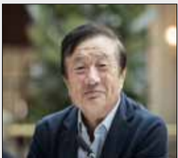
هو آوی ۲۸۶ میلیون دلار به کارمندان خود پاداش می‌دهد