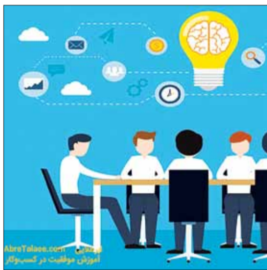
آموزش موفقیت در کسب و کار

ستاری عنوان داشت: صندوق پژوهش فناوری استان شش ماه است که تأسیس شده و ای کاش این صندوق سه سال پیش تأسیس می شد. معاون علمی فناوری رئیس جمهور گفت: اگر بخواهید موفق باشید باید سرمایه گذاری خطرپذیر را بپذیرید، لذا با پول تنها در خصوص اقتصاد دانش بنیان برعکس اقتصاد نفتی کاری نمی توان انجام داد.