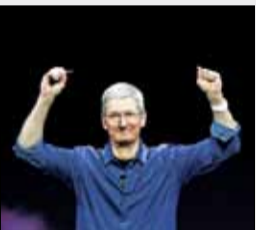
ایل جایگاهش را از مایکروسافت پس گرفت