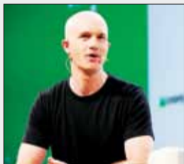
برایان آرمسترانگ میلیاردر بزرگ ارزهای دیجیتال