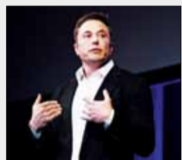
عربستان به دنبال خرید بخش بزرگی از سهام تسلا