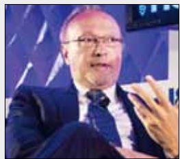
اپل واچ دیگر مردم را هیجان زده نمی‌کند