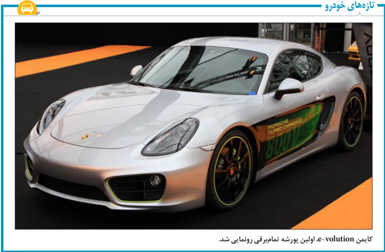
کایمن e-volution، اولین پورشه تمام برقی رونمایی شد.

طی یک سخنرانی در بورس اوراق بهادار نیویورک در روزهای گذشته، رئیس فیات کرایسلر آقای «سرجیو مارچونه» تأیید کرد که فراری در رابطه با تولید یک محصول کاملاً جدید بسیار «جدی و مصمم» است. هر چند حدود ۳۰ ماه طول خواهد کشید تا شرکت خودروسازی فراری تصمیم نهایی خود را در مورد آن چیزی که می خواهد تولید کند، بگیرد. محصولی که بیشتر به عنوان یک خودروی FUV شناخته خواهد شد. رئیس ۶۵ ساله فیات کرایسلر در ادامه توضیح داد: ما در این مورد بسیار جدی هستیم، ما باید یاد بگیریم که چگونه این رابطه جدید بین یک خودروی انحصاری و محصولی را که کمبود آن حس می شود مدیریت کنیم، پس این موضوع بدان معنا خواهد بود که ما یک وسیله نقلیه کاملاً جدید را در برنامه ریزی خود خواهیم داشت که به صورت محدود تولید شده و به دست مشتریان می رسد.