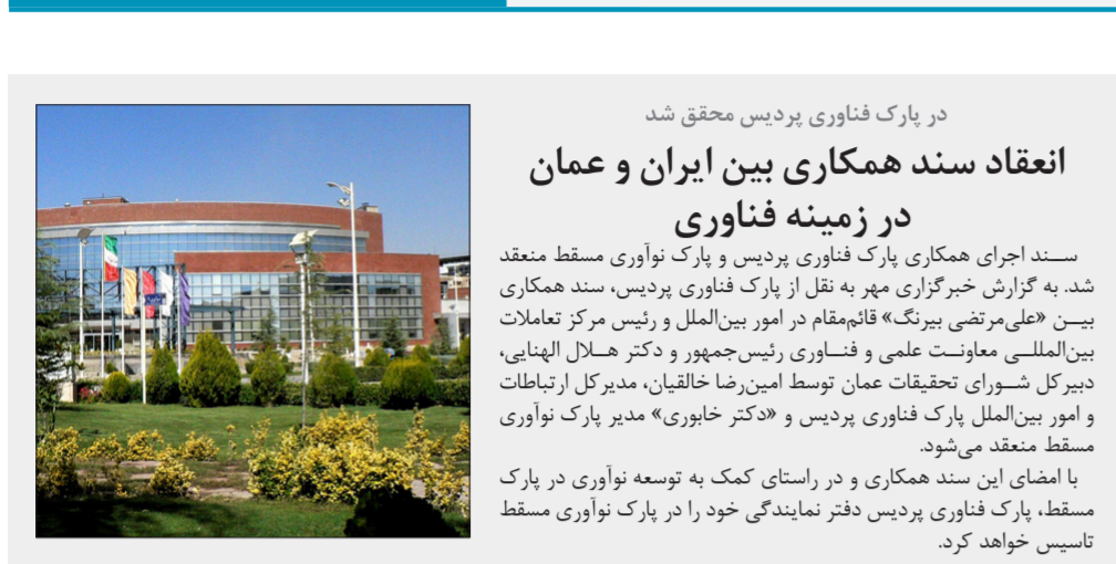
در پارک فناوری پردیس محقق شد