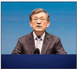
مدیرعامل سامسونگ الکترونیکس از سمت خود استعفا می‌کند