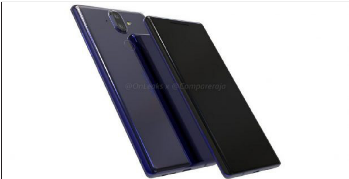
جدیدترین تصاویر نوکیا ۹ خبر از محصولی بدون حاشیه نمایشگر می‌دهد