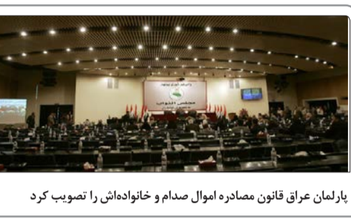
پارلمان عراق قانون مصادره اموال صدام و خانواده‌اش را تصویب کرد