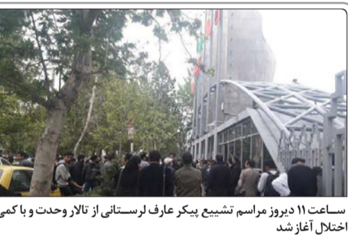
ساعت ۱۱ دیروز مراسم تشییع پیکر عارف لرستانی از تالار وحدت و با کمی اختلال آغاز شد