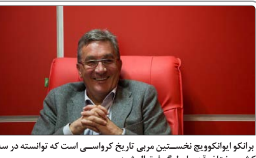
برانکو ایوانکوویچ نخستین مربی تاریخ کرواسی است که توانسته در سه کشور مختلف قهرمان لیگ فوتبال شود