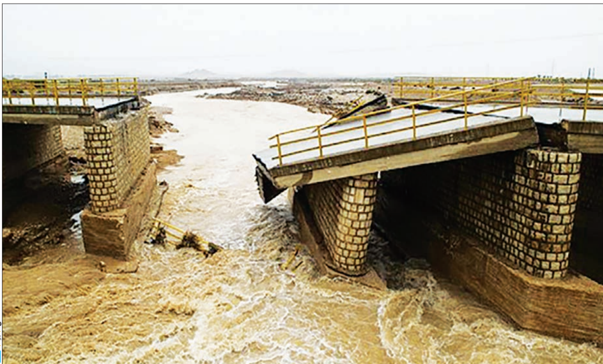
رئیس سازمان مدیریت بحران کشور از ادامه عملیات جست‌وجو برای یافتن مفقودین در سیل آذربایجان خبر داد.