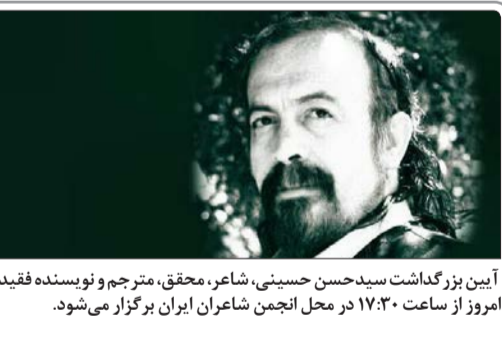
آیین بزرگداشت سیدحسن حسینی، شاعر، محقق، مترجم و نویسنده فقید، امروز از ساعت ۱۷:۳۰ در محل انجمن شاعران ایران برگزار می‌شود.