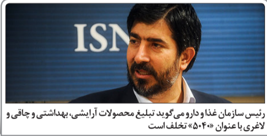
رئیس سازمان غذا و دارو می‌گوید تبلیغ محصولات آرایشی، بهداشتی و چاقی و لاغری با عنوان «۵۰۴» تخلف است