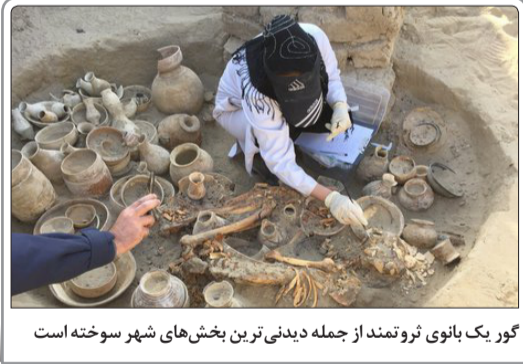
گور یک بانوی نژوتمند از جمله دیدنی‌ترین بخش‌های شهر سوخته است

نمایش «آدم، آدم است» به کارگردانی حبیب دانش در تالار مولوی با حضور جمشید مشایخی افتتاح شد. وزیر فرهنگ و ارشاد اسلامی بعد از امضای تفاهیم‌نامه با کشور اسلواکی در زمینه فرهنگی یک گلاب‌پاش فیروزه‌کوبی به وزیر اسلواکی هدیه داد و وزیر این کشور نیز یک ظرف کریستال چک را به وزیر ایران هدیه کرد.