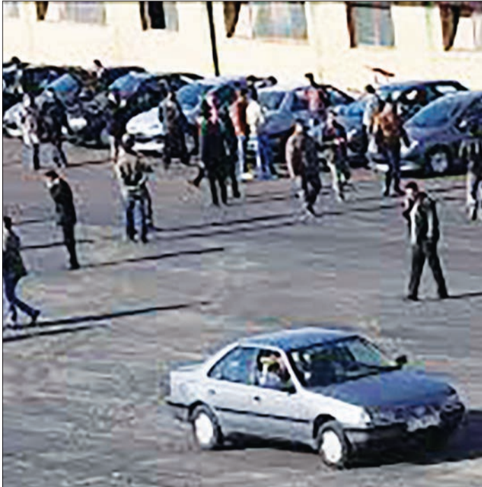
رمضان، این رکود و افت خریدفروش ادامه پیدا خواهد کرد و تا پایان بهار، شاهد این روند خواهیم بود. در این شرایط، در حال حاضر در بازار خودروهای صفر، قیمت پراید SE131 حدود ۲۰ میلیون و ۸۵۶ هزار تومان، پراید SE111 هزار تومان است.

با این وجود، تحلیل فعالان بازار خودرو این است که با توجه به نزدیک بودن انتخابات و نیز ماه مبارک