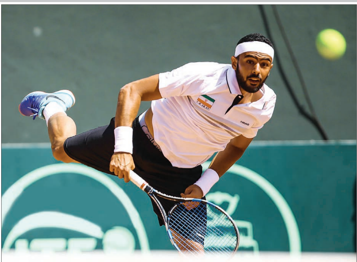
دومین روز مسابقات تنیس جام دیویس دیروز در اصفهان برگزار شد