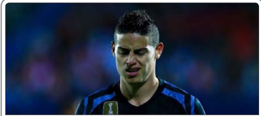
زلاتان مادرید خامس رودریگز را می‌فروشد

تیم ملی فوتبال ایران در دوره شش ساله حضور کی‌روش توانسته بعد از حدود یک دهه بار دیگر به جمع ۳۰ تیم برتر جهان بازگردد. تیم‌های فوتبال زنان کره شمالی و جنوبی در دیداری بی‌سابقه در استادیوم کم‌آب سونگ در پیونگ یانگ کره شمالی با هم مسابقه دادند. این دیدار ۴۰ هزار تماشاگر داشته است.