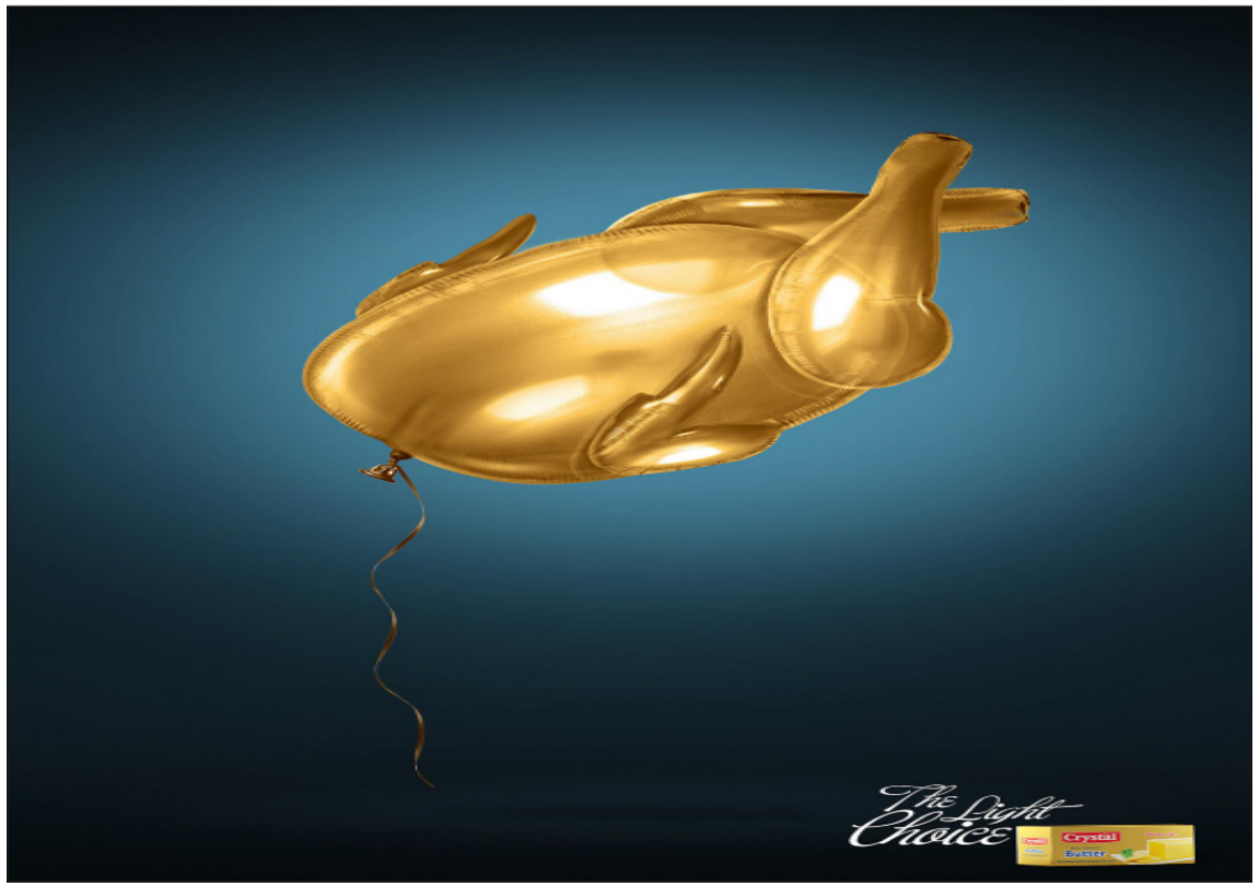
آگهی: crystal batter _ شعار: انتخاب سبک