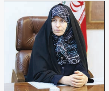
معاون رئیس جمهوری:

روابط بین جوامع میزبان و مهمان بر پایه فرهنگ و احترام استوار است