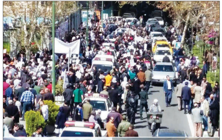
سپرده‌گذاران موسسه کاسپین روز گذشته مقابل ساختمان بانک مرکزی تجمع کردند