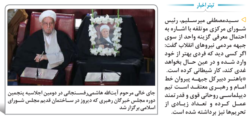
جای خالی مرحوم آیت‌الله هاشمی‌رفسنجانی در دومین اجلاس هیئت مدیره دوره مجلس خبرگان رهبری که دیروز در ساختمان قدیم مجلس شورای اسلامی برگزار شد

سرلشکر جعفری در جمع فرماندهان سپاه: سپاه همانند گذشته حق دخالت سیاسی در انتخابات را ندارد فرمانده کل سپاه تأکید کرد که احدی از پاسداران و فرماندهان سپاه همانند گذشته حق دخالت سیاسی و جناحی در انتخابات را ندارند. سردار سرلشکر پاسدار محمدعلی جعفری، فرمانده کل سپاه در جمع فرماندهان و مسئولان سپاه با بیان اینکه «پاسداران انقلاب همواره و صیای حضرت امام (ره) و منویات امام خامنه‌ای (مدظله العالی) در پرهیز از ورود به احزاب و دسته‌بندی‌های