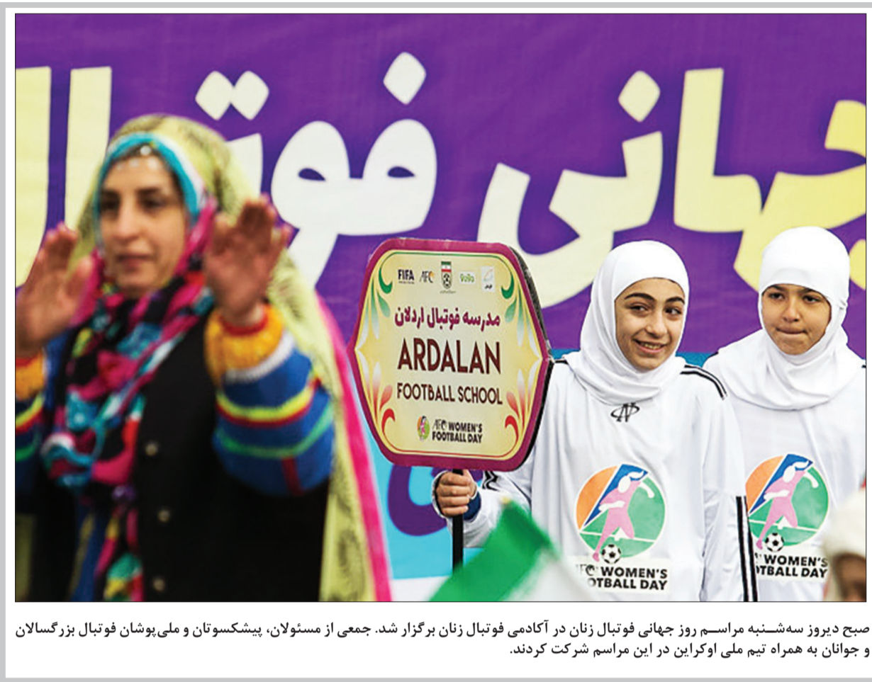
صبح دیروز سه‌شنبه مراسم روز جهانی فوتبال زنان در آکادمی فوتبال زنان برگزار شد. جمعی از مسئولان، پیشکسوتان و ملی پوشان فوتبال بزرگسالان و جوانان به همراه تیم ملی اوکراین در این مراسم شرکت کردند.