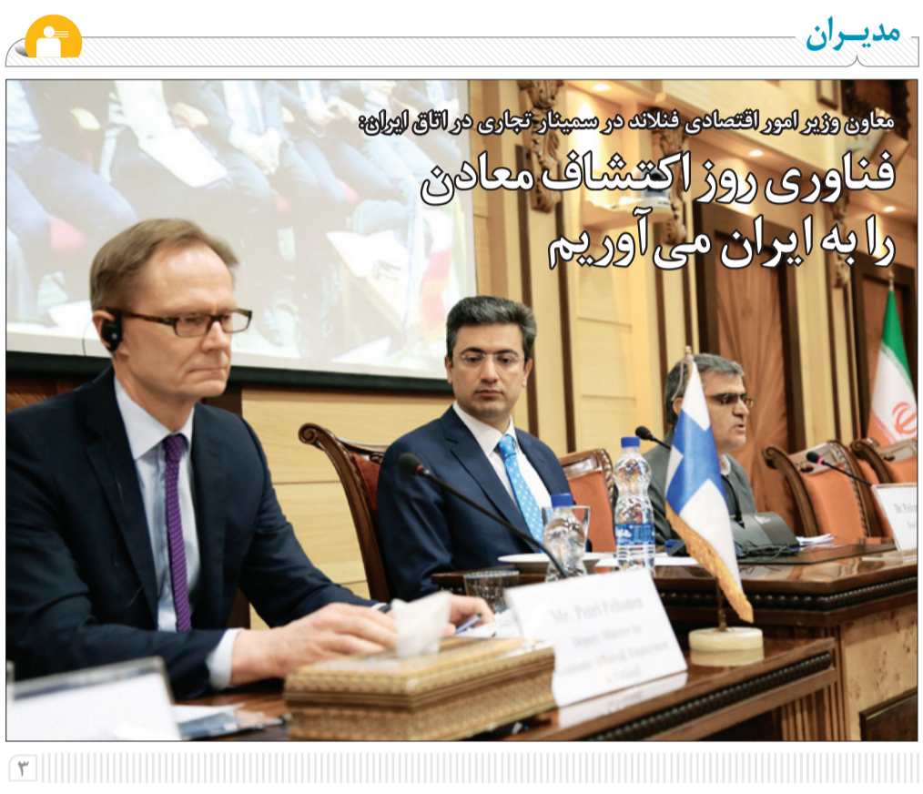
معاون وزیر امور اقتصادی فنلاند در سمینار تجاری در اتاق ایران: فناوری روز اکتشاف معادن را به ایران می‌آوریم