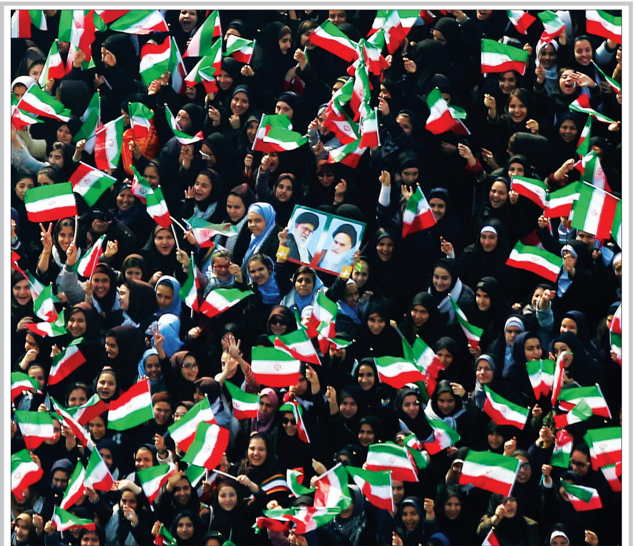
رئیس جمهور: مردم در راهپیمایی ۲۲ بهمن با حضور گسترده خود به تهدیدها پاسخ لازم را می دهند.