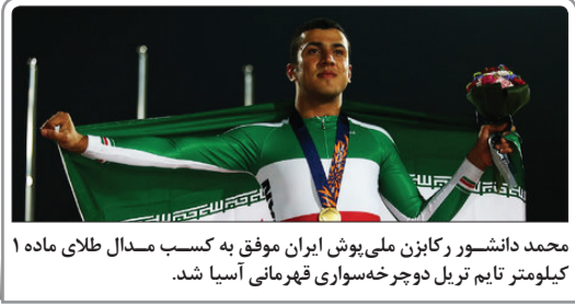
محمد دانشمند راکبزن ملی پوش ایران موفق به کسب سدال طلای ماده ۱ کیلومتر تایم تریل دوچرخه سواری قهرمانی آسیا شد.

علی خسروی «کارشناس داوری گفت: اسم «علیرضا فغانی» با توجه به عملکرد ایده آل و تجربه گرانبها، برای قضاوت در شهر آورد آرامش بخش است. این دیدار ویتربین فوتبال ایران است و همه باید برای برگزاری مطلوب آن، کمک کنند.