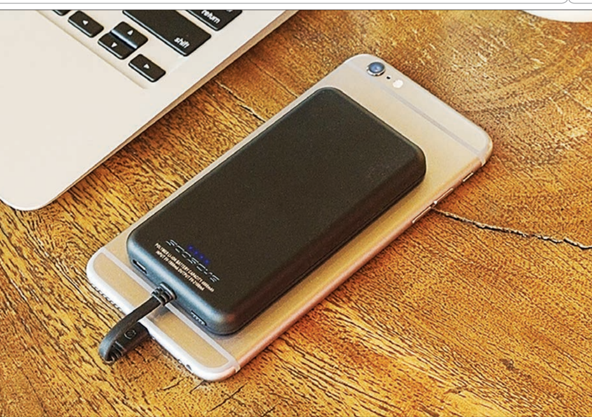
این دستگاه برای شارژ کردن تلفن های همراه خود استفاده کنند. قیمت این پاوربانک ۴۰۰۰ میلی آمپری در حدود ۵۰ دلار است.