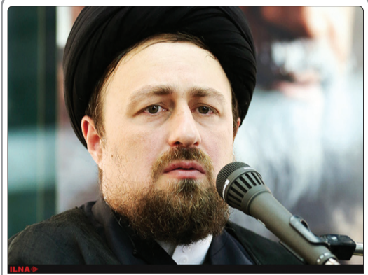
سید حسن خمینی با بیان اینکه حرکت امام مبتنی بر سلاح نبود، گفت: امام خمینی به نوعی انقلاب اسلامی را از جریان نواب صفوی جدا می داند.

سوال: پیشنهاد در مورد دولتی های فرانسوی و یکی از کشورهای ، یمن ، سوریه ، عراق ، ایران ، سودان ، سومالی ، لیبی ، که طی حکم رئیس جمهور ترامپ ، از رفتن به این کشور ممنوع شده اند ، چیست ؟ پاسخ: شهروندان فرانسوی که دارای ملیت یکی از این هفت کشور هستند ، می توانند درخواست ویزای ورود به آمریکا را با پاسپورت فرانسوی به عمل آورند .