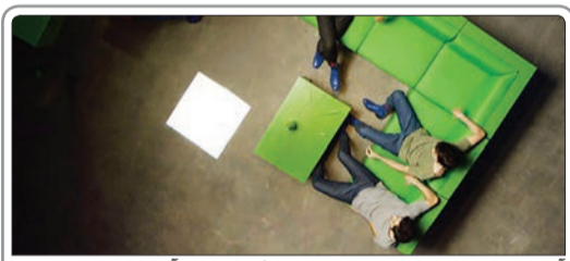
آنونس فیلم سینمایی «تمارض» به کارگردانی عبدایست برای حضور در بخش فرم شصت و هفتمین بریناله منتشر شد

◀ یکصد روزنامه‌نگار حوزه فرهنگ و هنر از دبیر جشنواره فیلم فجر درخواست کردند امکانی فراهم کند تا فیلم «آشغال‌های دوست‌داشتمنی» ساخته محسن امیریوسفی در جشنواره فیلم فجر به نمایش گذاشته شود.