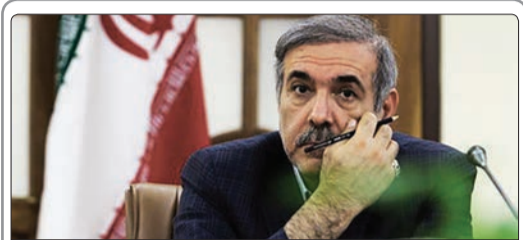
مرتضی بانک معاون کل نهاد ریاست جمهوری: شورای شهر نتوانسته به طور کامل به وظایف و برنامه‌های خود عمل کند

شفاف گزارش شود. موضوع محرمانه‌ای نباید وجود داشته باشد مگر در مسائل امنیتی که واضح و مستثنی است، متأسفانه این استثنا در کشور تبدیل به قاعده شده است. عضو فراکسیون امید اظهار کرد: حکومتی کارآمد است که مردم احساس کنند در خدمت‌شان است، وظایف را به نحو احسن انجام دهد و مدیریت و تدبیر داشته باشد. صادقی با بیان اینکه حکومت نباید بیت‌المال را حیف و میل کند، عنوان کرد: یکی از ویژگی‌های دیگر حکومت رعایت اصل امانت و عدالت است. اینکه بودجه و درآمد کشور نباید بی‌خود و بی‌جهت صرف شود اما به‌ظاهر عده‌ای هم میل و هم حیف می‌کنند.