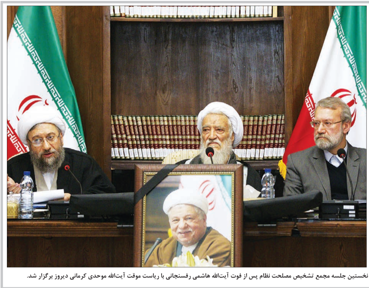
نخستین جلسه مجمع تشخیص مصلحت نظام پس از فوت آیت‌الله هاشمی رفسنجانی با ریاست موقت آیت‌الله موحی کرمانی دیروز برگزار شد.

ایمیل: INFO@FORSATNET.IR | سایت: WWW.FORSATNET.IR