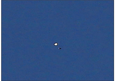
شیء مشکوک دیده شده در آسمان

صدای شلیک ضد هوایی دیروز حوالی ساعت ۱۶:۴۹ دقیقه در میدان و خیابان انقلاب طنین انداخت. به گفته شاهدان عینی این صدا تا شعاع ۵ کیلومتری نیز شنیده می شد. صدای شلیکها حدود دو تا سه دقیقه ادامه داشت و سپس سکوت بر آسمان تهران حکمفرما شد.