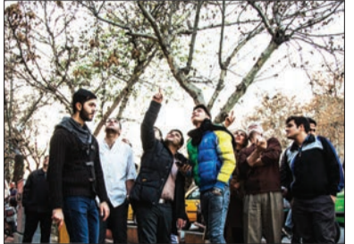
واکنش مردم به صدای شلیک