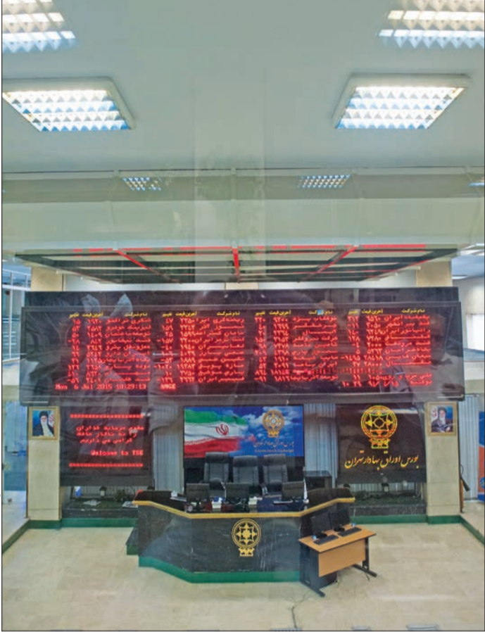
بازار بورس اوراق بهادار تهران

در سومین روز معاملات بورس اوراق بهادار تهران در این هفته نمادهای گروه فرآورده های نفتی رشد قابل قبولی را تجربه کردند. همچنین در معاملات کم حجم، نمادهای گروه قندی نیز شاهد روند رو به رشد بودند. دماسنج بازار سهام نیز پس از ۱۱ واحد رشد به رقم ۷۹ هزار و ۸۲ واحدی رسید. روز دوشنبه شاخص کل بورس اوراق بهادار تهران از ابتدای باز شدن معاملات، روند نوسانی را پیش گرفت و در میانه ساعات دادوستدها توانست تا رقم ۷۹ هزار و ۱۱۳ واحدی بالا رود اما پس از آن با نوسان هایی رو به رو شد. همچنین شاخص کل هم وزن ۶ واحد رشد کرد و به عدد ۱۵ هزار و ۴۵۳ واحدی رسید. به این ترتیب پس از چند روز رشد قیمت ها و شاخص ها و عبور شاخص کل از کانال ۷۹ هزار واحدی، به دلیل نبود انرژی لازم برای ادامه روند صعودی بازار، شاهد ایستایی قیمت ها و شاخص ها بودیم. با این حال در معاملات روز گذشته نماد شرکت پالایش نفت بندرعباس با ۲۹ واحد تأثیر مثبت در شاخص کل بیشترین نقش را در نوسانات دماسنج بازار سهام داشت. در این نماد بیش از ۶۰ درصد فروش ها مربوط به سهامداران حقیقی و بیش از ۳۹ درصد از عرضه ها به سهامداران حقوقی مربوط می شود. قندی را نیز توانستند شاخص کل خوبی را رقم بزنند به طوری که تقریباً در تمامی نمادهای این گروه رشد مناسبی در قیمت پایانی مشاهده می شد. در این گروه بیش از ۴ میلیون سهم به ارزش ۹۵۱ در ۸۱۷ نوبت معامله مورد دادوستد قرار گرفت.