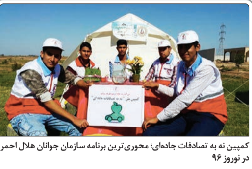
کمیته نه به تصادفات جاده ای؛ محوری ترین برنامه سازمان جوانان هلال احمر در نوروز ۹۶