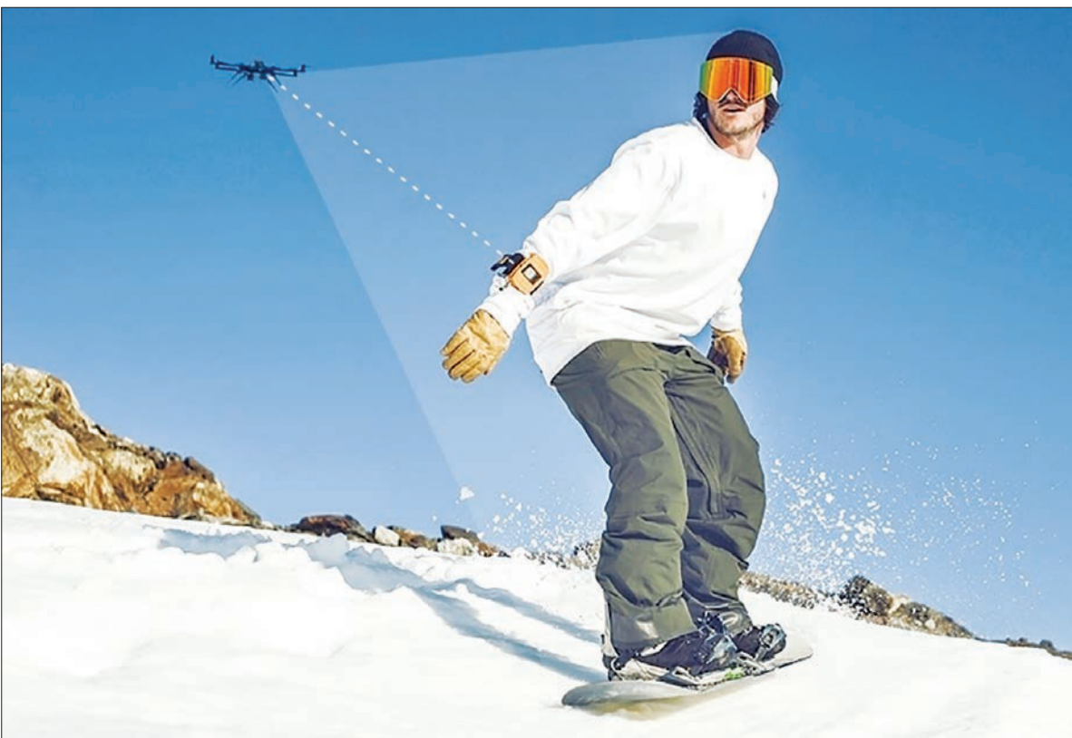
Staker Drone یک پهپاد ردیاب است که به طور ویژه برای اسکی‌بازان یا ورزشکارانی که در فضای باز فعالیت می‌کنند مناسب است. این پهپاد براساس ردیابی مچ‌بندی که به دست کاربر بسته شده کار می‌کند و توانایی این را دارد که با سرعت ۵۰ مایل بر ساعت پرواز کند. قیمت این گجت ۱۲۰۰ دلار است.