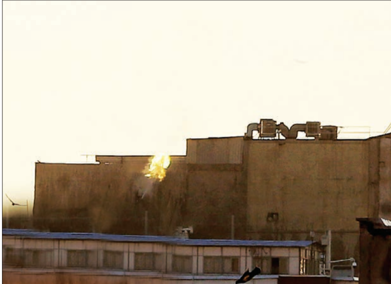
واکنش پدافند ضد هوایی