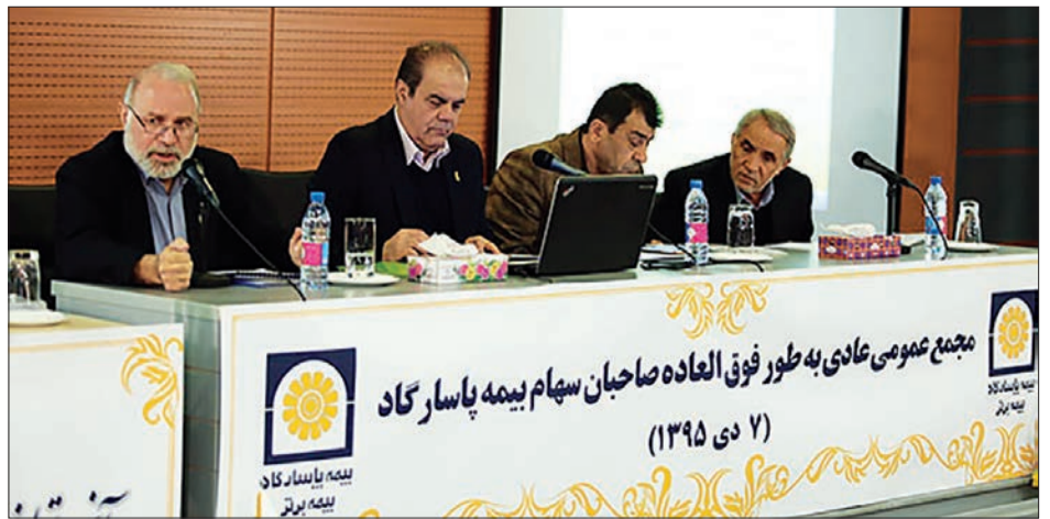
مجمع عمومی عادی به طور فوق العاده صاحبان سهام بیمه پاسارگاد (۲ دی ۱۳۹۵)

مجمع عمومی عادی به طور فوق العاده صاحبان سهام بیمه پاسارگاد با حضور بیش از ۹۷٪ درصد سهامداران روز سه‌شنبه، هفتم دی ماه در دانشگاه خاتم برگزار و دستور جلسه این مجمع به رأی سهامداران گذاشته شد.