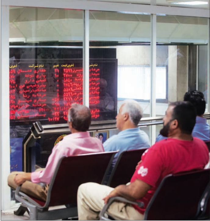
مشاوران بورس در حال رصد نمودارهای بازار

در آخرین روز معاملات بورس اوراق بهادار تهران در این هفته شاخص کل توانست پس از مدت‌ها کانال ۸۱ هزار واحدی را رد کند و با افزایش ۱۱۱ واحدی به رقم ۸۱ هزار و ۳۴۱ واحد رسید. روز گذشته در گروه خودرو مخالف روزهای گذشته در بیشتر نمادها شاهد رشد قیمت پایایی بودیم. در این گروه بیش از ۱۰۶ میلیون سهم به ارزش ۲۲ میلیارد و ۶۸۶ میلیون و ۹۰۰ هزار تومان مورد معامله قرار گرفت. همچنین در گروه استخراج کانه‌های فلزی شاهد روند افزایشی بودیم. در این گروه بیش از ۲۰۱ میلیون سهم به ارزش نزدیک به ۴۷ میلیارد تومان مورد دادوستد قرار گرفت. انتظار برای بازگشایی نماد معاملاتی سایپا در هفته آینده و در عین حال پایان اصلاح در این گروه، بازار سهام شاهد افزایش تقاضا نسبت به عرضه سهام در نمادهای خودرویی بود. از سوی دیگر شایعه فروش بلوک گسترش سرمایه‌گذاری ایران خودرو به بانک پارسیان به شکل گریب صف خرید سنگین در نماد خگستر انجامید. این روزها خوشبینی به ورود نقدینگی و ادامه جریان پول به فضای بورس تهران با رونق دوباره مولفه‌های بورسی بهار دیگری به چشم می‌آید و آینده بازار سهام با توجه به عبور بهای نفت از سطح ۵۰ دلاری و همچنین افزایش قیمت دلار در ماه‌های آینده، از سوی فعالان این بازار مثبت و رو به رشد ارزیابی می‌شود.