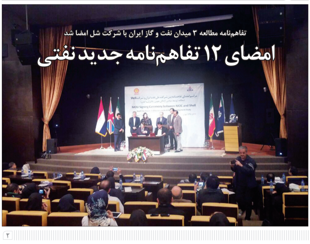
تفاهم‌نامه مطالعه ۳ میدان نفت و گاز ایران با شرکت شل امضا شد امضای ۱۲ تفاهم‌نامه جدید نفتی