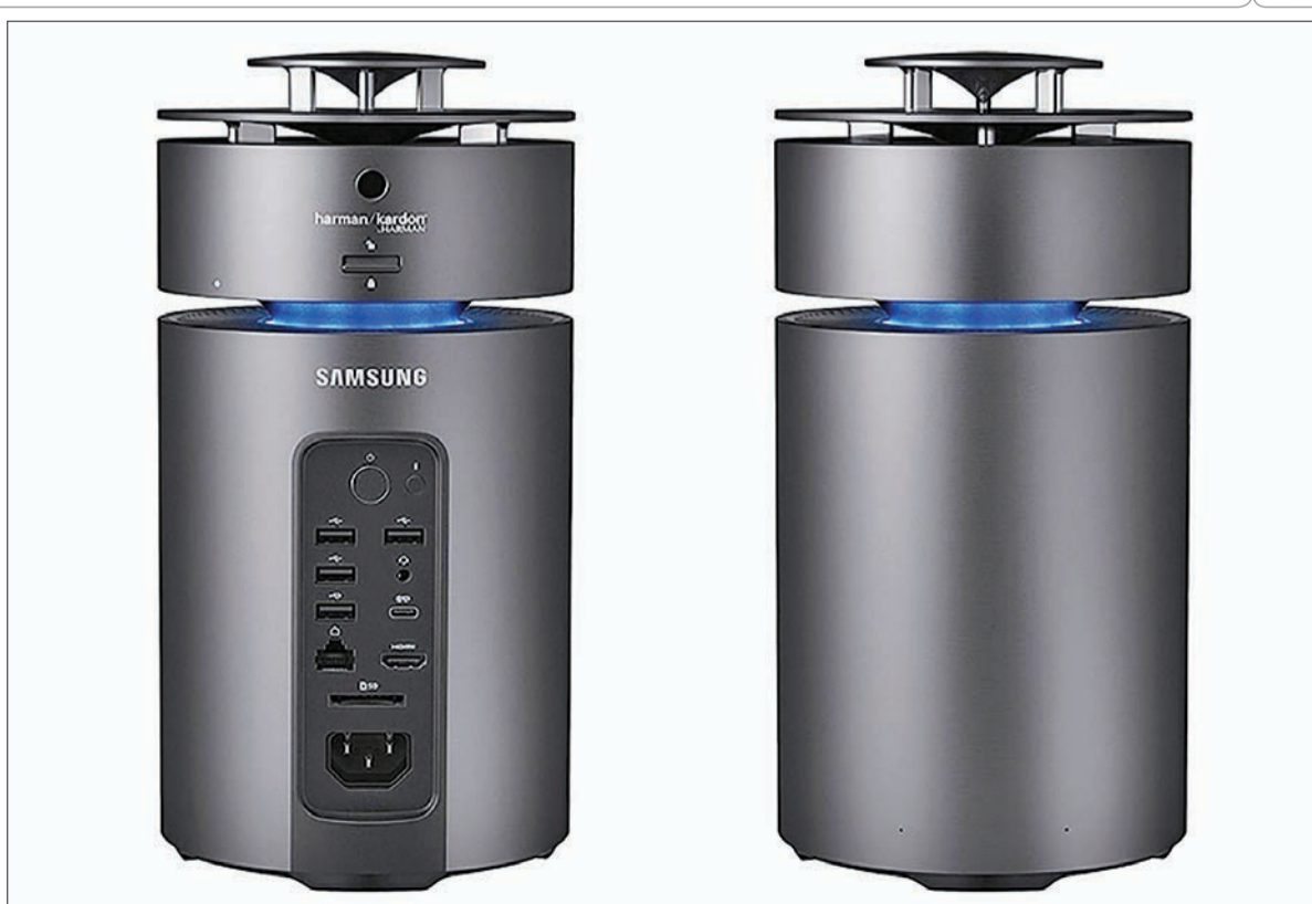
Samsung ArtPC Pulse یک مینی رایانه ترکیبی است که دارای پردازنده 3.7GHz با قدرت Core i7 و حافظه داخلی 16 گیگابایتی است. ابعاد این محصول 10,7 × 5 اینچ است و می‌تواند به عنوان یک رایانه رومیزی کوچک در نظر گرفته شود. قیمت این محصول از ۱۱۹۹ تا ۱۵۹۹ متفاوت است.

گوگل اعلام کرد تا سال ۲۰۱۷ میلادی به وعده خود درباره استفاده ۱۰۰ درصدی از انرژی‌های تجدیدپذیر در دیتاسنترها عمل می‌کند. به گزارش ایرنا، این شرکت در سال ۲۰۱۵ میلادی اعلام کرد تا سال ۲۰۱۷ به طور کامل از منابع تجدیدپذیر انرژی به منظور تامین توان موردنیاز دیتاسنترهای خود استفاده می‌کند. وبلاگ گوگل در این رابطه نوشت: در حال حاضر این شرکت بزرگ‌ترین خریدار انرژی تجدیدپذیر در جهان است. البته هنوز هم گوگل از سوخت‌های فسیلی استفاده می‌کند، اما در حال حاضر این شرکت به اندازه‌ای انرژی الکتریکی تجدیدپذیر خریداری کرده که تمام توان مصرفی دیتاسنترها و دفاتر خود را از این طریق تامین کند. شرکت گوگل ۱۳ دیتاسنتر دارد که مجموعاً در حدود ۵.۷ تراوات در ساعت، انرژی الکتریکی مصرف می‌کنند. در طول شش سال گذشته هزینه انرژی حاصل از باد و خورشید، به ترتیب ۶۰ و ۸۰ درصد کاهش یافته و این نوع انرژی‌ها را به یک گزینه کاملاً مقرون به صرفه تبدیل کرده است. اما از آنجا که باد دانه در حال وزیدن نیست، گوگل به سراغ منابع تجدیدپذیر دیگر انرژی رفته است تا تامین توان موردنیاز آن به طور دائمی تضمین شود. مهم‌ترین گزینه گوگل برای استفاده از انرژی‌های تجدیدپذیر، معافیت مالیاتی است که دولت وضع کرده است. اما احتمالاً این معافیت‌ها در طول چند سال آینده منتهی می‌شوند. با وجود این، از آنجا که هزینه تامین انرژی‌های تجدیدپذیر رو به کاهش است، گوگل نگرانی‌ای از بابت لغو معافیت‌های مالیاتی ندارد.