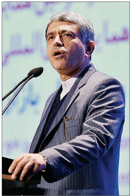
وزیر اقتصاد: تحریم‌ها قابل برگشت نیست