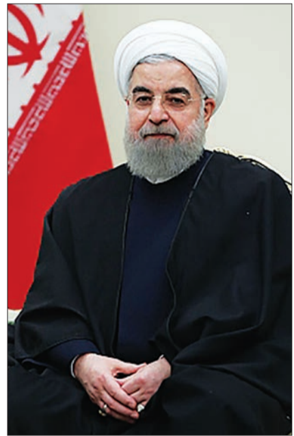
رئیس جمهوری: نباید کشوری برجام را تضعیف کند