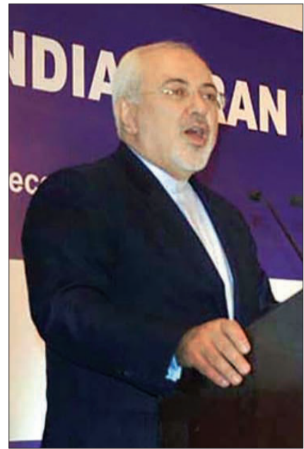
وزیر امور خارجه: تمدید تحریم‌ها اثر اجرایی ندارد