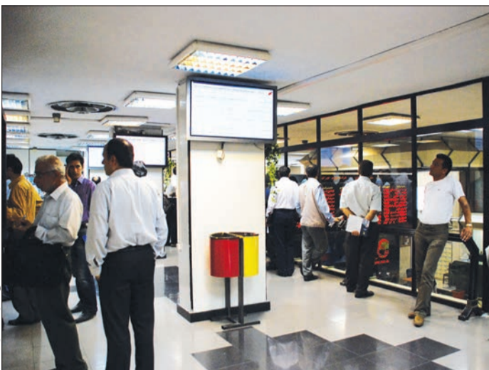
سهمی‌ها به صورت انبساطی

شاخص کل بورس اوراق بهادار تهران در نخستین روز معاملاتی هفته با حمایت نمادهای معدنی و فلزی ۱۵۵ واحد رشد کرد.