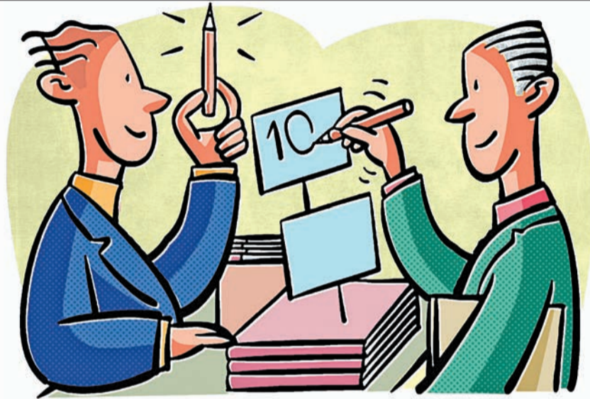
چطور می‌توان با تکیه بر حمایت سهامداران، به رشد و موفقیت مداوم دست پیدا کرد