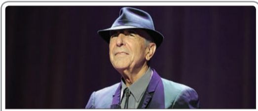
لئونارد کوهن، شاعر، رمان‌نویس و خواننده و ترانه‌سرای کاتادایی در سن ۸۲ سالگی درگذشت

آن مطرح است، با بیان اینکه مجموعه «معمای شاه» مجموعه‌ای عظیم و لقمه‌های بزرگ است که در ساخت آن عجله شده است، مطرح کرد: شما می‌خواهید ۱۰۰ سال را در یک سریال نشان دهید؛ به‌عنوان مثال واقعه کربلا را اگر بخواهی در یک فیلم سینمایی یا سریال بگنجانی چیز خوبی از آب در نمی‌آید، اما زمانی که کاری مثل «روز واقعه» یا مجموعه‌ای مثل «سفیر» را می‌سازی که به حاشیه‌های کربلا می‌پردازد، آن وقت است که از فیلم یا سریال استقبال می‌شود. سوال اینجاست که چرا می‌خواهیم زمان زندگی امه را به شکلی سطحی در یک سریال بیابوریم که هیچ‌گاه خوب از آب در نمی‌آید، بنابراین گرفتاری اصلی «معمای شاه» همین مسئله است.