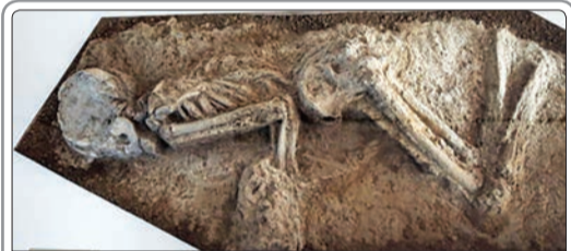
رجبعلی خسروآبادی، مدیرکل میراث فرهنگی تهران از کشف جمجمه یک اسکلت متعلق به ۳۰۰۰ سال قبل در محدوده خیابان بهارستان تا ظهیرالاسلام خبر داد

او در عین حال گفت: اخیراً لایحه مقابله با حیوان‌آزاری با همکاری کارشناسان، تشکل‌های مردمی حامی حیوانات و صاحب‌نظران تهیه و برای بررسی به دولت ارائه شده است. ابتکار گفت: سگ‌ها جزئی از چرخه اکوسیستم محسوب می‌شوند و فواید هم دارند و اگر به درستی مدیریت نشوند ممکن است مشکلاتی را ایجاد کنند. اگر تمام سگ‌ها در یک محیط روستایی یا شهری از بین بروند، قطعاً تعادل جمعیتی به سمت دیگر حیوانات نظیر گرگ‌ها متمایل خواهد شد. وجود سگ‌ها با جمعیت متعادل و به شکل کنترل و مدیریت شده که مشکلات و بیماری‌هایی به دنبال نداشته باشد هم یکی از ضرورت‌ها به‌شمار می‌رود.