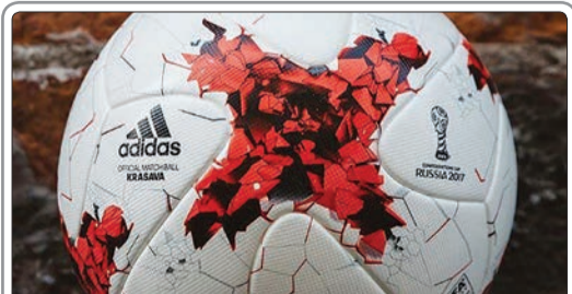
کرازاولا، توپ رسمی فیفا از سال ۲۰۱۷ در رقابت‌های ملی استفاده خواهد شد

سلسنه در این شرایط کار سختی برای صعود خواهد داشت. لیونل مسی پس از این شکست در برابر برزیل گفت: اصلاً برزیل را تهدید نکردیم عملکر دمان عجیب بود. این در حالی است که عکس‌هایی از نیمار و مسی در حین بازی در فضای مجازی منتشر شده که نشان از دلداری هم‌تیمی برزیلی به مسی دارد. نیمار با گلزنی در این دیدار پنجاهمین گل ملی خود را به ثمر رساند.