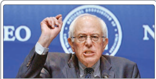
برنی سندرز، سناتور دموکرات ایالت ورمونت گفت: ترامپ اگر بخواهد کار اشتباهی در قبال مسلمانان، زنان و همجنس‌گرایان انجام دهد و مردم را علیه آنان تحریک کند، آنگاه ما بدترین کابوس شبانه‌اش خواهیم شد

ترامپ همچنین پس از دیدار با رهبران جمهوریخواه کنگره آمریکا اولویت‌های خود برای ریاست‌جمهوری را اعلام کرد. او گفت: ما به دنبال آن هستیم که به بررسی قدرتمند مسئله مهاجرت و مرزها بپردازیم و همچنین قصد داریم به شکلی جامع و قدرتمند مسئله بهداشت و درمان را بررسی کنیم و به مسئله ایجاد اشتغال و اشتغال‌زایی فراگیر خواهیم پرداخت. ترامپ از پاسخ به این سوال که آیا از کنگره خواهد خواست ورود مسلمانان به آمریکا را ممنوع کند، طفره رفته و تنها جواب داد از همه شما متشکرم.