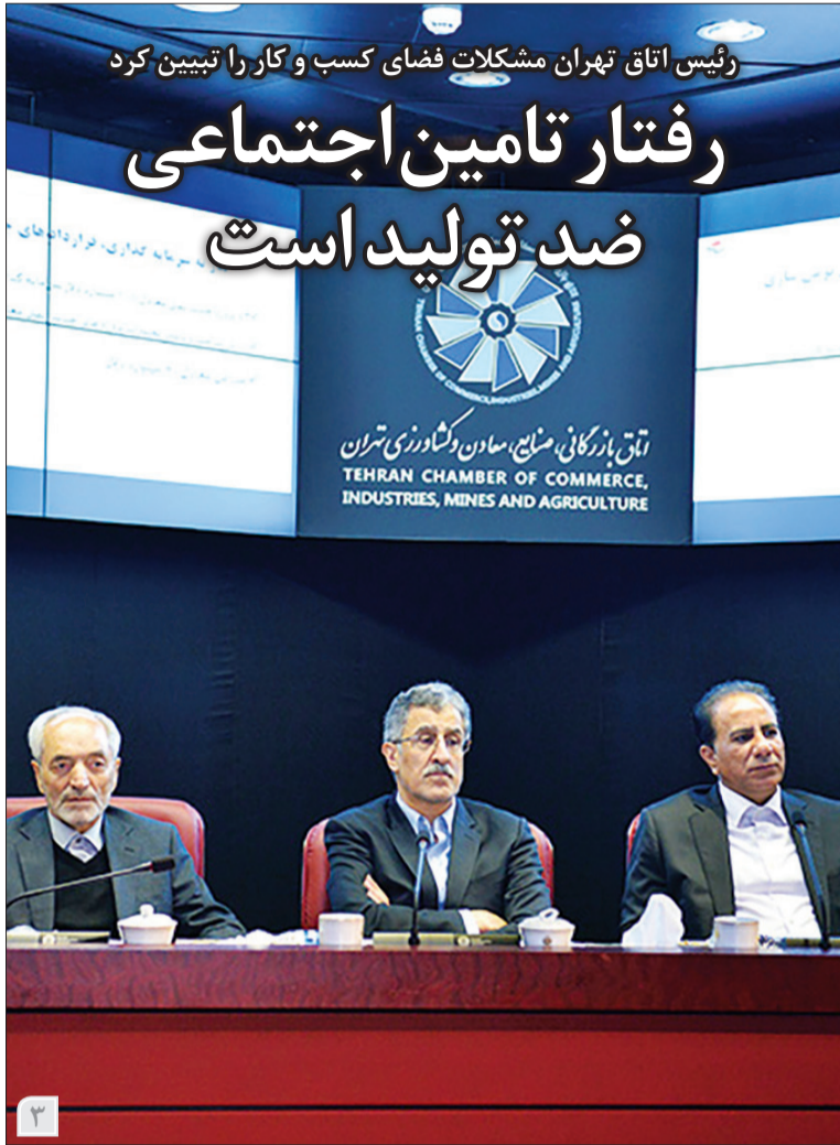
رئیس اتاق تهران مشکلات فضای کسب و کار را تبیین کرد