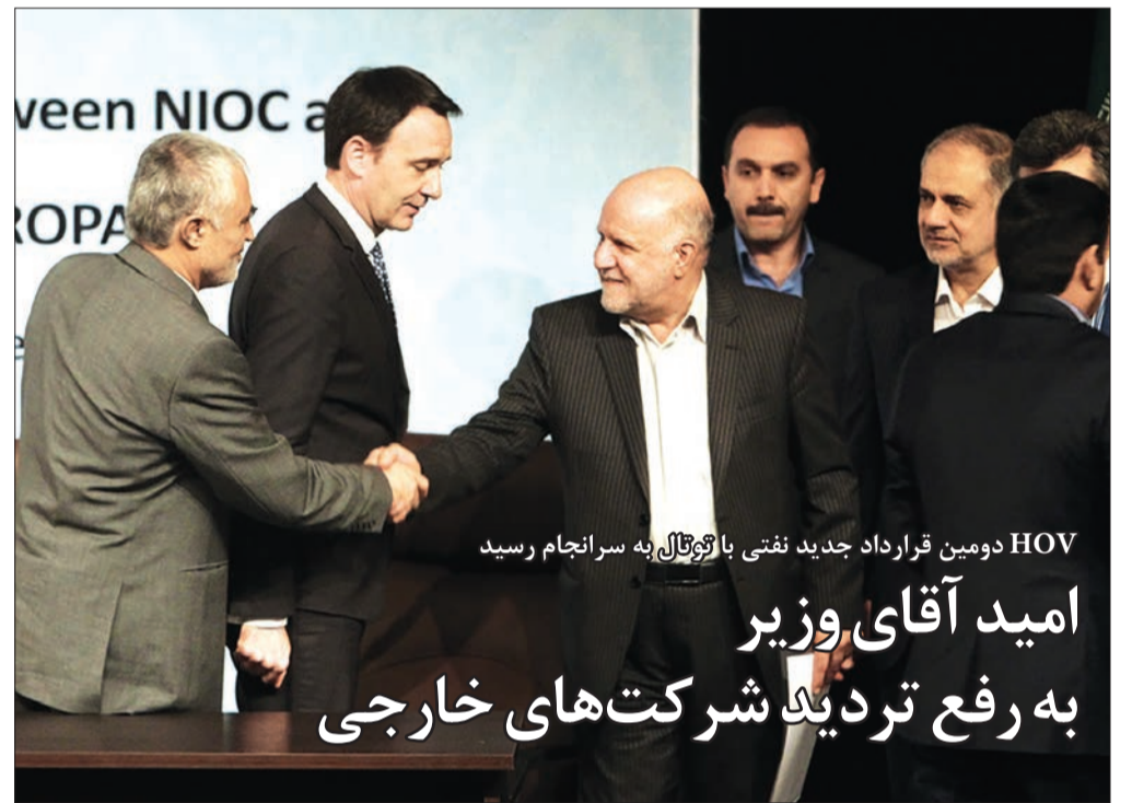
HOV دومین قرارداد جدید نفتی با روتال به سرانجام رسید