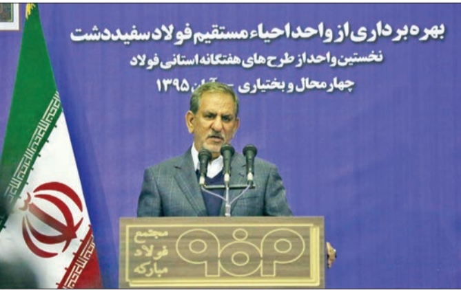
توسعه این طرح‌ها دعوت به عمل می‌آورد.

همچنین در افتتاحیه مراسم فولاد سفیددشت مهدی کرباسیان، رئیس هیأت عامل سازمان توسعه و نوسازی معادن و صنایع معدنی اظهار کرد: هفت یا به عبارتی هشت طرح فولادی یکی از موضوع‌های تاریخی در زمینه احداث فولاد است. زمانی که دولت جدید سسر کار آمد جزو یکی از آرزوهای چهارمحال و بختیاری افتتاح طرح فولاد سفیددشت بود.