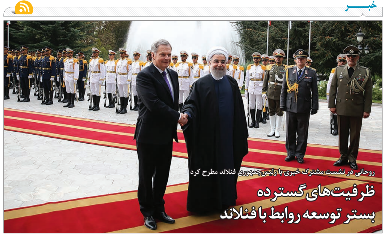
روحانی در نشست مشترک خبری با رئیس‌جمهوری فنلاند مطرح کرد ظرفیت‌های گسترده بستر توسعه روابط با فنلاند