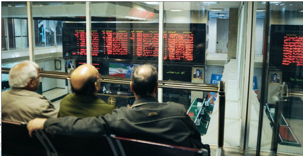
سهمی از لحظه معاملات امروز