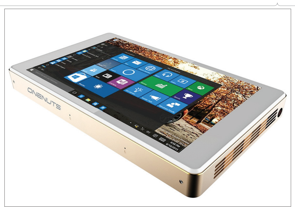
Onenuts T1 یک مینی کامپیوتر ۸ اینچی است که به واسطه پروژکتور داخلی و بسیار کاربردی خود معروف شده است. حافظه این مینی کامپیوتر ۲ گیگابایت است. این مینی کامپیوتر مبتنی بر ویندوز نسخه ۱۰ است. قیمت این محصول ۹۹ دلار است.