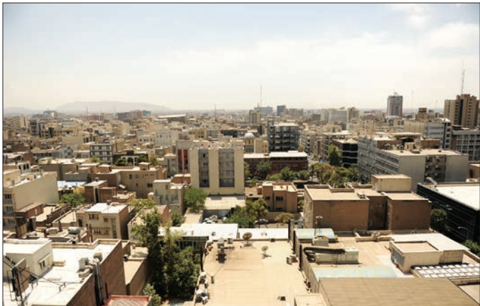
پروژه مسکن ایران در تهران

سیر راه ورود خارجی‌ها به بازار مسکن ایران گفت: در سطح بازار خرد قطعاً احتیاجی به حضور خارجی‌ها نخواهد بود، زیرا ورود به این بازار نیاز به شناخت دقیق نیازها خواهد داشت و سطح سرمایه‌گذاری نیز تا جایی نیست که برای خارجی‌ها بهره‌چندانی داشته باشد.