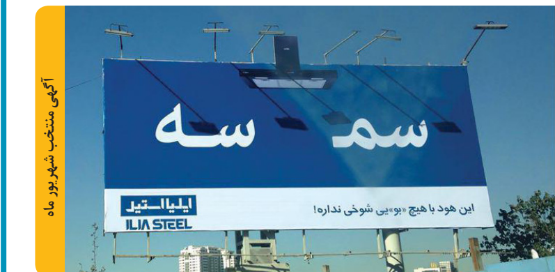
آگهی منتخب شهریور ماه