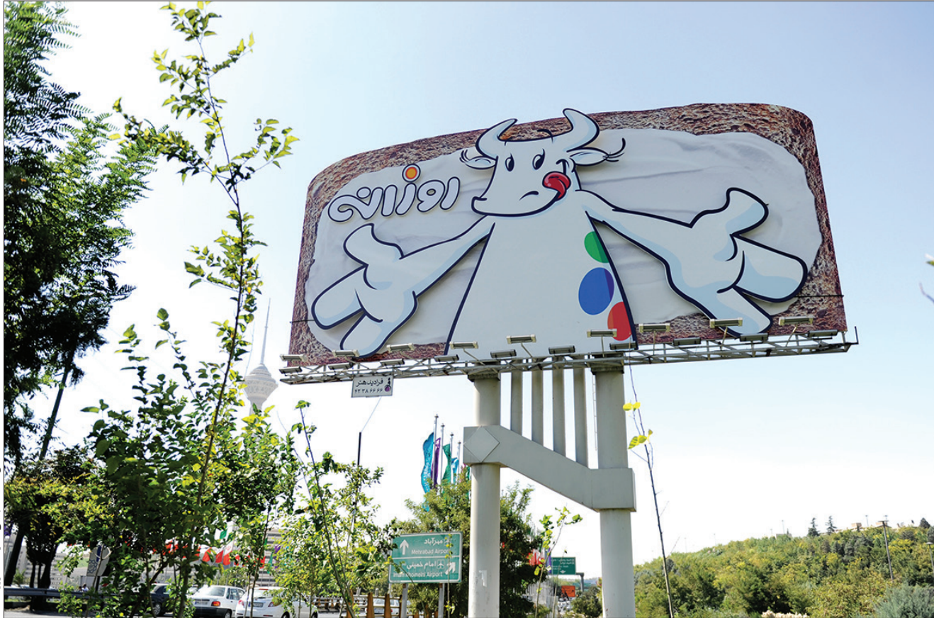
عکس تهیه شده به سفارش آژانس امروز

لوگوی نصب شده روی بیلپورد برند روزانه، شب‌ها درخشان