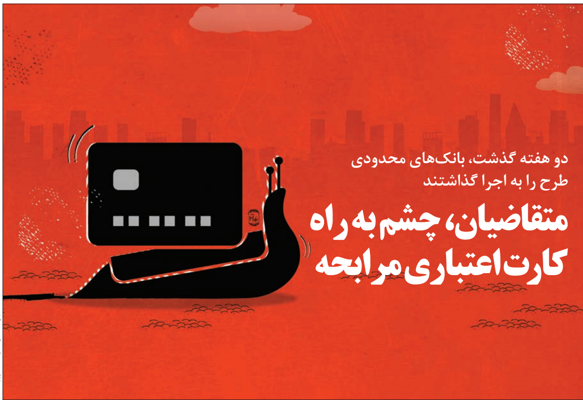
نهاد پانجو فرصت امروز

همه بانک‌ها باید در این طرح مشارکت کنند و اگر بانک یا موسسه اعتباری در این طرح شرکت نکنند، ممکن است ناشی از کمبود منابع آن باشد ولی اصل بر مشارکت است و این تکلیف بانک مرکزی به بانک‌ها بوده که حتماً باید در این طرح حضور داشته باشند و ما بانک‌ها را رصد می‌کنیم. در رتبه‌بندی بانک‌ها توسط بانک مرکزی طبیعی است بانکی که در ارائه این تسهیلات به مشتری اقدام کند، از امتیاز بیشتری برخوردار خواهد شد.