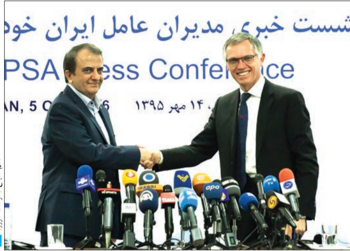
عظیم صالح، رئیس ایران خودرو

بیان کرد: ۲۵ درصد عددی است که اگر به آن برسیم، رویالیتی پرداخت نخواهیم کرد و البته این رقم شامل مونتاژ و رنگ نمی‌شود اما به هر حال داخلی‌سازی قطعات در سال اول به ۴۰ درصد خواهد رسید.