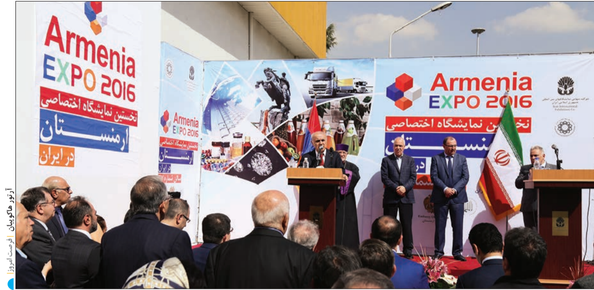
آزاد هاشمی‌نژاد، معاون وزیر صنعت، معدن و تجارت ایران، در مراسم افتتاح نمایشگاه اختصاصی ارمنستان در تهران.

دبیر کمیسیون قاچاق کالا و ارز گفت: در صورتی که مجوزهای قانونی برای واردات کالایی دریافت نشود مجالی برای عرضه و ثبت آن کالا وجود ندارد. او در خصوص امحای کالاهای قاچاق اظهار داشت: در صورتی که حکم قطعی برای قاچاق بودن کالایی صادر و قاچاق بودن کالا مسجل شود، قطعاً آن کالا امحا خواهد شد.