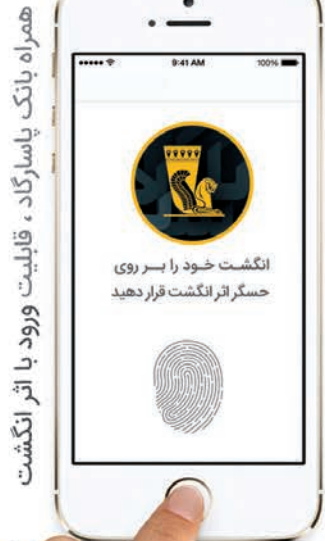
همراه بانک پاسارگاد، قابلیت ورود با اثر انگشت