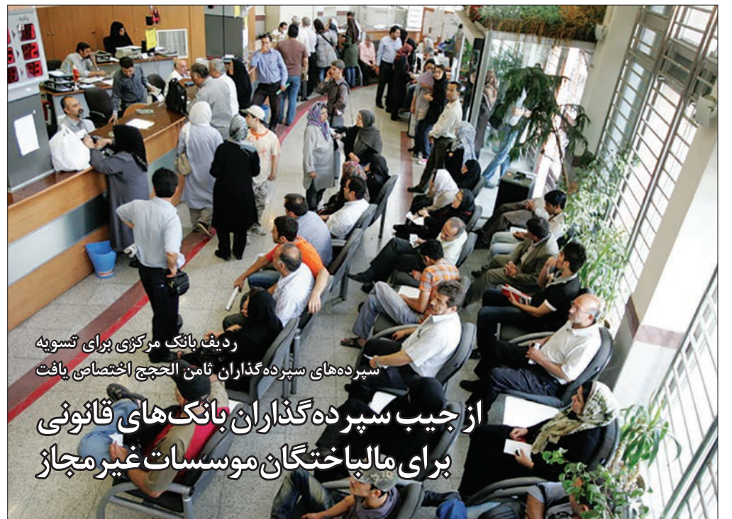
ردیف بانک مرکزی برای تسویه سپرده‌های سپرده‌گذاران ثامن الحجج اختصاصی یافت