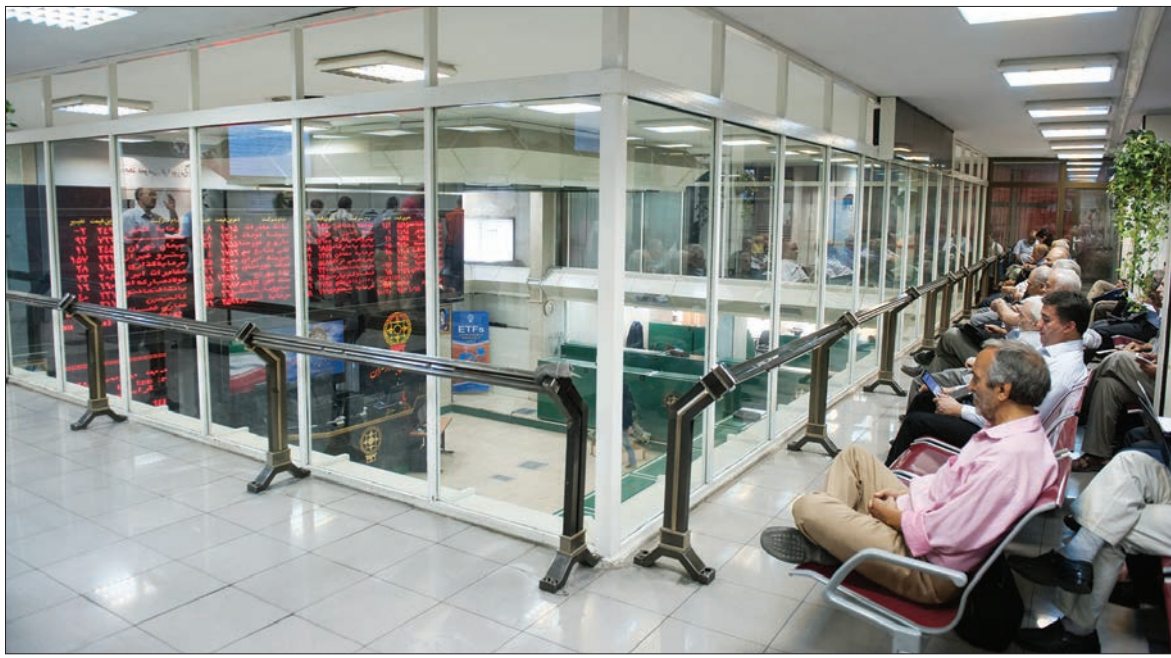
صحنه موسیقی فراوان فرصت امروز

شاخص سهام بورس‌های مهم اروپایی شامل فوتسی ۱۰۰ لندن، دکس آلمان، ایکس اسپانیا همزمان با سقوط قیمت نفت خام برنت دریای شمال کاهش یافت. ارزش شاخص سهام بورس فوتسی ۱۰۰ لندن در آخرین روز کاری هفته با کاهش ۰.۳۰ درصدی مواجه شد و با ۲۰ واحد کاهش، به ۷۱۰ واحد رسید. ارزش شاخص سهام کک چهل در بورس فرانسه ۰.۹۳ درصد، دکس در بورس فرانکفورت آلمان ۱.۵۰ درصد، و شاخص بورس اسپانیا موسوم به «آیبکس» یک درصد کاهش داشت. این کاهش ارزش سهام در حالی روی داده است که هر بشکه نفت خام سبک برنت دریای شمال روز جمعه در بازار لندن، با ۸۶ سنت کاهش به کانال ۴۵.۷۵ دلاری وارد شد و همچنین بهای هر بشکه نفت شاخص آمریکا، «وست تگزاس» با ۹۹ سنت کاهش به ۴۲.۹۲ دلار رسید.