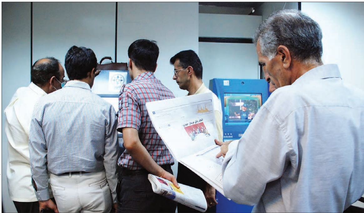
سینما سهامی | ارزش امروز

شرکت سرمایه‌گذاری بهممن صورت وضعیت پرتقوی دوره یک ماهه منتهی به ۳۱ مرداد ماه ۹۵ را به صورت حسابرسی نشده منتشر کرد. شرکت سرمایه‌گذاری بهممن در ابتدای دوره یک‌ماهه یاد شده تعدادی از سهام چند شرکت بورسی را با بهای تمام شده ۲ هزار و ۲۷۵ میلیارد و ۶۵۸ میلیون ریال و ارزش بازار ۲ هزار و ۲۷۲ میلیارد و ۳۰۵ میلیون ریال در سبد سهام خود داشت.