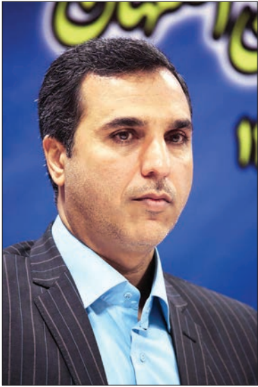
وزارت راه و شهرسازی با سازمان راه آهن جمهوری اسلامی ایران داشته‌اید؟ قرارداد رسمی منعقد نشده اما تفاهم‌نامه‌ای مرتبط با خرید ریل از شرکت ذوب آهن اصفهان میان وزیر