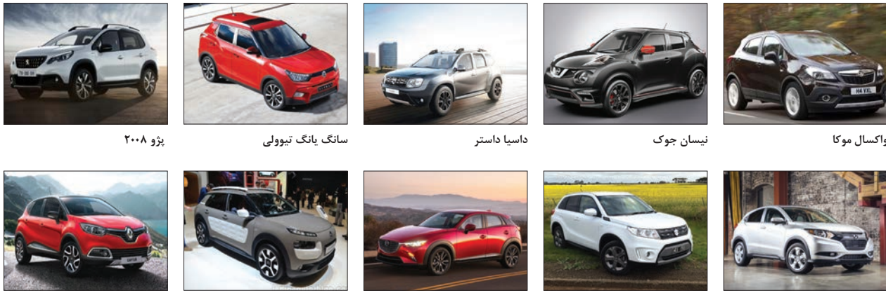
واکسال موکا نینسان جوک داسیا داستر هوندا HR-V سوزوکی ویتارا مزدا CX-3 سانتاگ یانگ تیوولی رنو کیچر