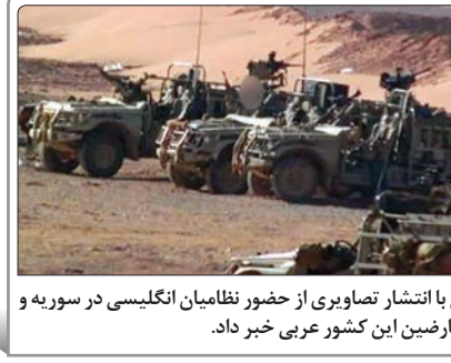
یک رسانه غربی با انتشار تصاویری از حضور نظامیان انگلیسی در سوریه و حفاظت آنها از معارضین این کشور عربی خبر داد.

دولت ترامپ که در هفته گذشته با حمایت از «پل‌رایان» نوبت اتحاد در حزب جمهوریخواه داده بود، بار دیگر موجب بروز تنش در این حزب شد. به گزارش خبرگزاری مهر به نقل از سی ان ان، نامه ۵۰ چهره برجسته حزب جمهوریخواه علیه ترامپ به‌شدت با واکنش وی مواجه شده و نامزد ریاست جمهوری از حزب جمهوریخواه آمریکا در واکنش به انتقاد بی‌سابقه ۵۰ شخصیت امنیتی این حزب از او، گفت: این افراد همان کسانی هستند که باید درباره وضعیت اقتضاح امروز جهان به مردم آمریکا پاسخ دهند. ۵۰ نفر از چهره‌های شناخته شده حزب جمهوریخواه