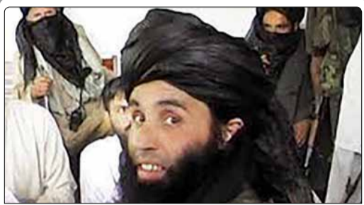
دولت محلی ایالت خیبر- پختونخوای پاکستان برای ارائه اطلاعاتی که به بازداشت رهبر طالبان پاکستان منجر شود، ۱۰۰ هزار دلار جایزه تعیین کرد

رییس‌جمهور ترکیه در اولین ماه ۲۰۱۵ به تهران سفر می‌کند. به گزارش روزنامه زمان در ترکیه، رجب طیب اردوغان، در رأس هیاتی بلندپایه در ماه ژانویه به ایران سفر می‌کند. در همین راستا، ابتدا به سه کشور آفریقایی