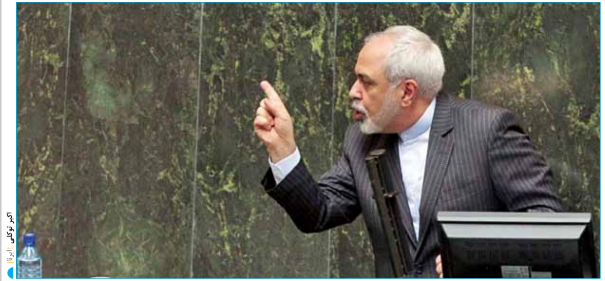
محمدجواد ظریف در صحن علنی مجلس: