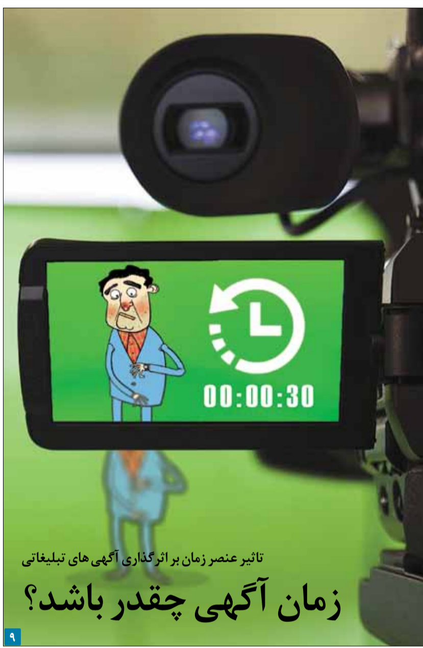
تاثیر عنصر زمان بر اثرگذاری آگهی‌های تبلیغاتی

پس از اظهارات وزیر بهداشت، نمایندگان مجلس با ۲۵ رأی موافق، ۱۵۶ رأی مخالف و ۱۱ رأی ممتنع از مجموع ۲۱۶ نماینده حاضر با حذف ماده ۴۷ مخالفت کردند.