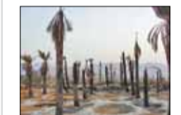
فرصت‌های سوخته در حوزه گردشگری جنگ