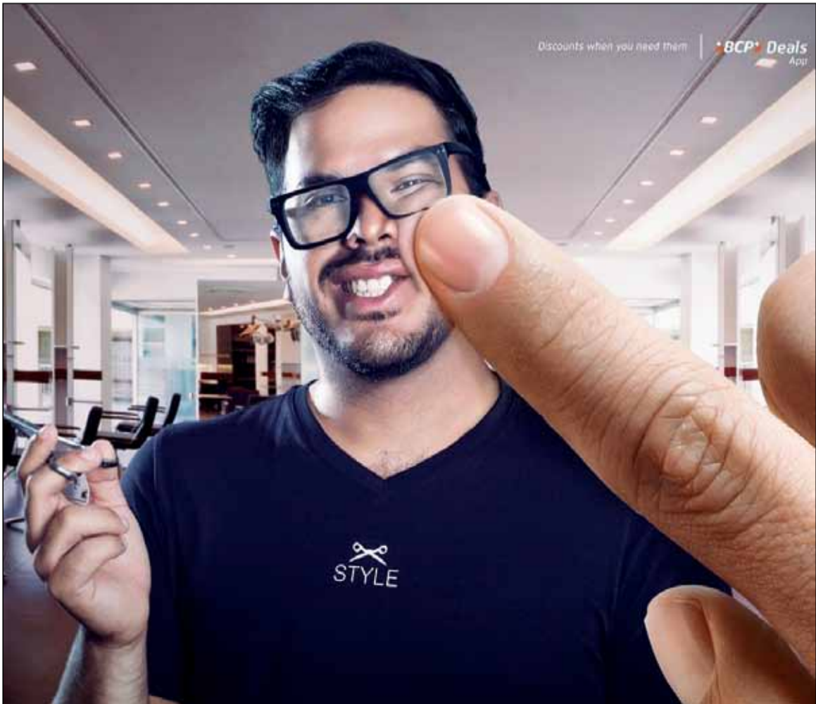
آگهی: بانک BCP - شعار: ارائه تخفیف زمانی که شما به آن نیاز دارید!