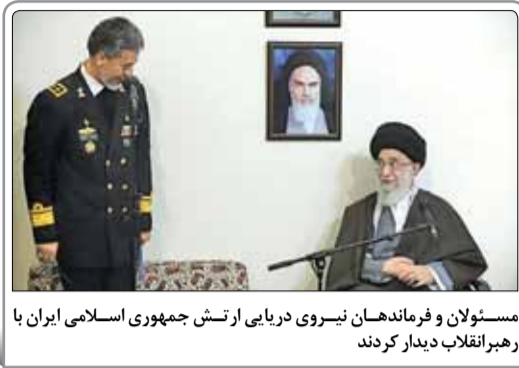
مسئولان و فرماندهان نیروی دریایی ارتش جمهوری اسلامی ایران با رهبرانقلاب دیدار کردند