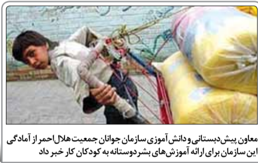
معاون پیش‌دستانی و دانش‌آموزی سازمان جوانان جمعیت هلال‌احمر از آمادگی این سازمان برای ارائه آموزش‌های پیش‌روستانه به کودکان کار خبر داد