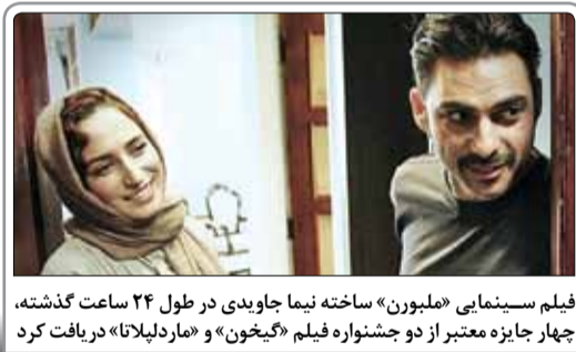
فیلم سینمایی «ملبورن» ساخته نیما جابودی در طول ۲۴ ساعت گذشته، چهار جایزه معتبر از دو جشنواره فیلم «گیخون» و «ماد لیلاتا» دریافت کرد