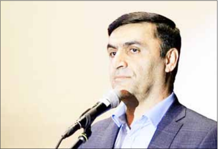
و همت همه کارکنان این شرکت است.

وی ادامه داد: این میزان گاز تزریق شده از سوی مناطق نفتخیز جنوب به شبکه گاز کشور، بیشتر از برنامه ابلاغی از سوی وزارت نفت است و این مساله نشان دهنده توان