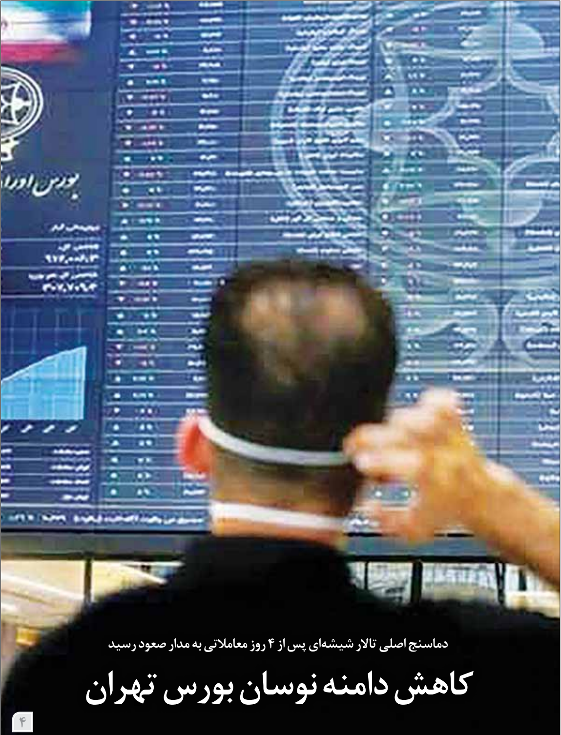
داماسنج اصلی تالار شیشه‌ای پس از ۴ روز معاملاتی به مدار صعود رسید