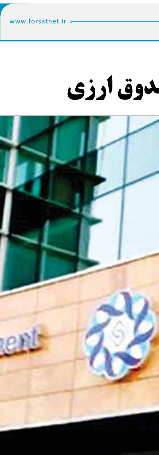
گزارش بازوی پژوهشی مجلس و صندوق توسعه ملی نشان می‌دهد

«قیطاسی» با بیان اینکه تسهیلاتی با نرخ کمتر از ۱۰ درصد وجود ندارد، خاطرنشان کرد: از سال ۱۳۹۵ تا به توجیه به ابهاماتی که در جامعه در رابطه با نرخ پایین تسهیلات کارکنان بانک مطرح شده بود، در قانون بودجه تصریح شد که برای کارکنان بانک‌ها، کارگروهی متشکل از وزیر امور اقتصادی و دارایی، ریاست کل بانک مرکزی و ریاست سازمان برنامه و بودجه تشکیل شد تا برای سقف تسهیلات کارکنان نظام بانکی تصمیم‌گیری شود و نرخ آن براساس مصوبه شورای پول و اعتبار مشخص شد که در مردادماه ۱۳۹۵ شورای پول و اعتبار صادر شد، مقرر شد نرخ تسهیلات کارکنان شبکه بانکی، حداقل ۱۰ درصد باشد و امروز در شبکه بانکی، تسهیلاتی با نرخ کمتر از ۱۰ درصد وجود ندارد. به گفته دبیر شورای هماهنگی بانک‌ها، در بانک‌های دولتی نیمه دولتی که عضو شورای هماهنگی بانک‌ها هستند، دستگاه‌های نظارتی از جمله، دیوان محاسبات، سازمان بازرسی کل کشور و بازرسان قانونی حضور دارند. آخرین نسخه از مقررات و دستورالعمل مربوط به تسهیلات نظام بانکی مربوط به سال ۱۴۰۱ (تیمبره ۴ ذیل ماده ۱۱ ضوابط اجرایی قانون بودجه سال ۱۴۰۱) است که براساس آن مقرر است، مجموع تسهیلات اعطایی برای کارکنان شبکه بانکی و شرکت‌های دولتی، بیش از ۴۰ برابر سقف تعیین شده در تیمره ذیل ماده ۷۶ قانون مدیریت خدمات کشوری نباشد. بنابراین براساس دستورالعمل فوق، در پایان سال گذشته جمع و یا سقف تسهیلات پرداختی به کارکنان بانک‌های دولتی و نیمه دولتی کشور ۶۹۲ میلیون تومان است. بر این اساس اظهاراتی به وجود آمده که همه کارکنان شبکه بانکی در سال گذشته ۶۹۲ میلیون تومان وام دریافت کرده‌اند که این سقف جمعیع یک دوره ۳۰ ساله برای کارکنان است.