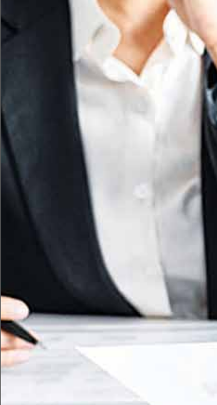
مصاحبه استخدامی در یک شرکت

شروع به کار در یک موقعیت تازه برای هیچ کس ساده نیست. حتی کارآفرینانی با چند دهه سابقه کاری نیز وقتی پای یک ماجراجویی تازه در میان باشد، کمی تردید خواهند داشت. درست به همین خاطر خیلی از کارمندان حتی سراغ تغییر شغل‌شان هم نمی‌روند؛ حتی اگر بدترین شرایط کاری را هم داشته باشند! فعالیت در یک شرکت تازه نه تنها برای کارمندان سخت خواهد بود، بلکه تیم مدیریتی را نیز نگران می‌سازد. اجازه دهید ماجرا را با یک مثال کاربردی توضیح دهیم. تهیه‌کننده‌ای را در نظر بگیرید که در طول ۲۰ سال گذشته با یک مجری شناخته‌شده همکاری داشته و برنامه‌اش هم حسایی پرربننده از آب درآمده است. حالا