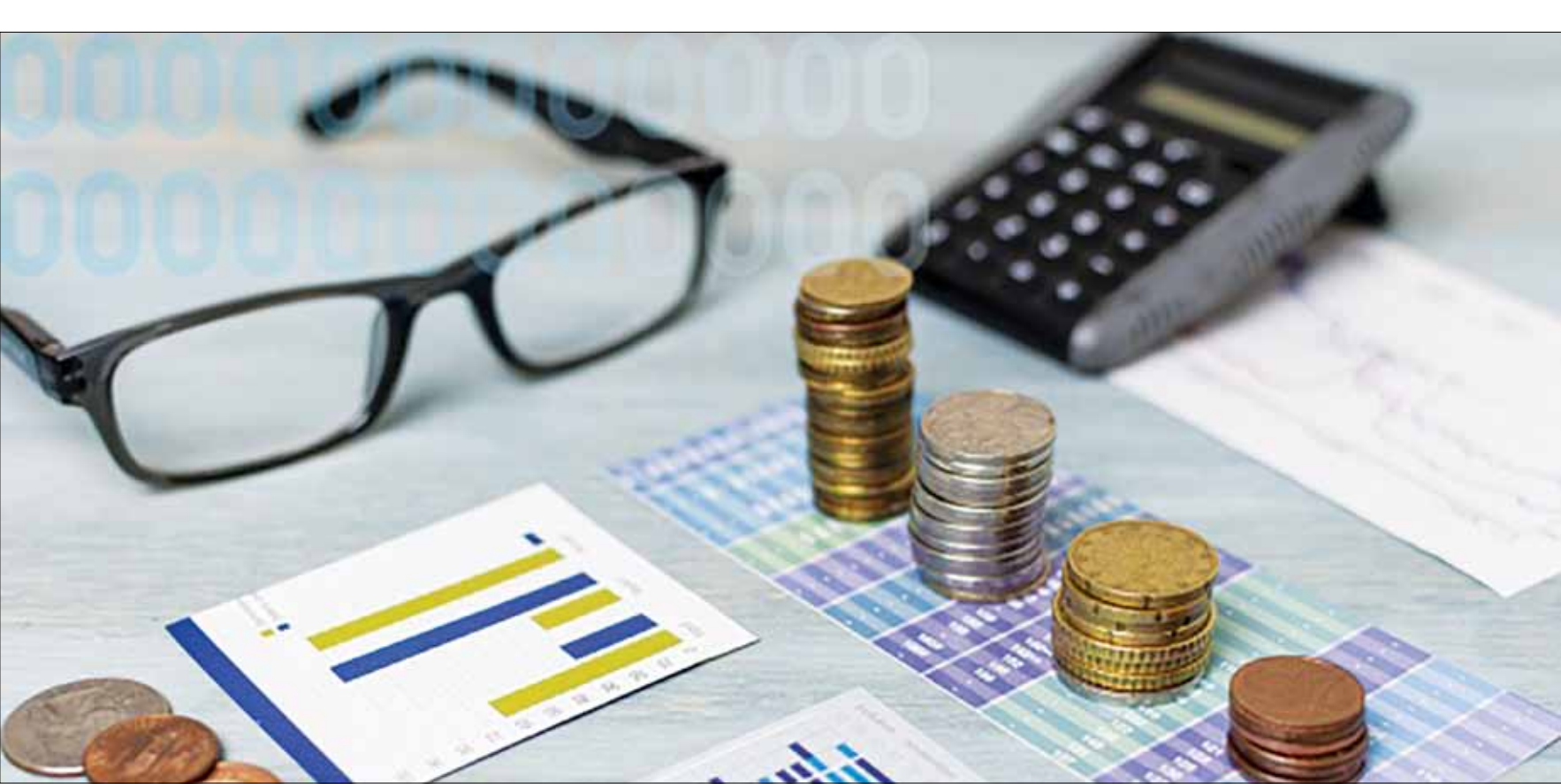
هزینه تولید در بزرگ‌ترین بخش اقتصاد ایران بالا رفت

درصد در اردیبهشت امسال به ۴.۵ درصد در خرداد کاهش یافته است. باید توجه داشت که کاهش تورم تولید به معنای کاهش هزینه تولید نیست بلکه نشان می‌دهد هزینه‌ها با سرعت کمتری نسبت به اردیبهشت افزایش یافته است. از میان اجزای گروه خدمات، بالاترین تورم تولیدکننده ماهانه مربوط به «فعالیت‌های حرفه‌ای، علمی و فنی» با نرخ ۸.۶ درصد و پایین‌ترین سطح آن مربوط به «آبرسانی و مدیریت پسماند» با تورم صفر بوده است. در مقابل، تورم تولیدکننده نقطه به نقطه بالا رفته است. این نرخ در اردیبهشت امسال ۳۹.۹ درصد بود اما در خرداد به ۴۶.۲ درصد افزایش یافته است. به عبارت دیگر، هزینه تولید خدمات در خرداد امسال ۴۶.۲ درصد نسبت به خرداد سال گذشته افزایش یافته که در مقایسه با نرخ اردیبهشت ماه، از سرعت بالاتری برخوردار است. بالاترین تورم تولیدکننده نقطه به نقطه در خردادماه امسال، مربوط به بخش «آبرسانی و مدیریت پسماند» بوده که متأثر از افزایش مقطعی هزینه‌ها در ماه‌های قبل است. در نهایت، تورم تولیدکننده سالانه نیز از حدود ۴۹.۸ درصد به ۴۸.۷ درصد رسیده و کاهش یافته است. از میان اجزای گروه خدمات، شدیدترین رشد سالانه هزینه‌های تولید ۷۰ درصد بوده که مربوط به «فعالیت‌های تامین جا و غذا» می‌شود.