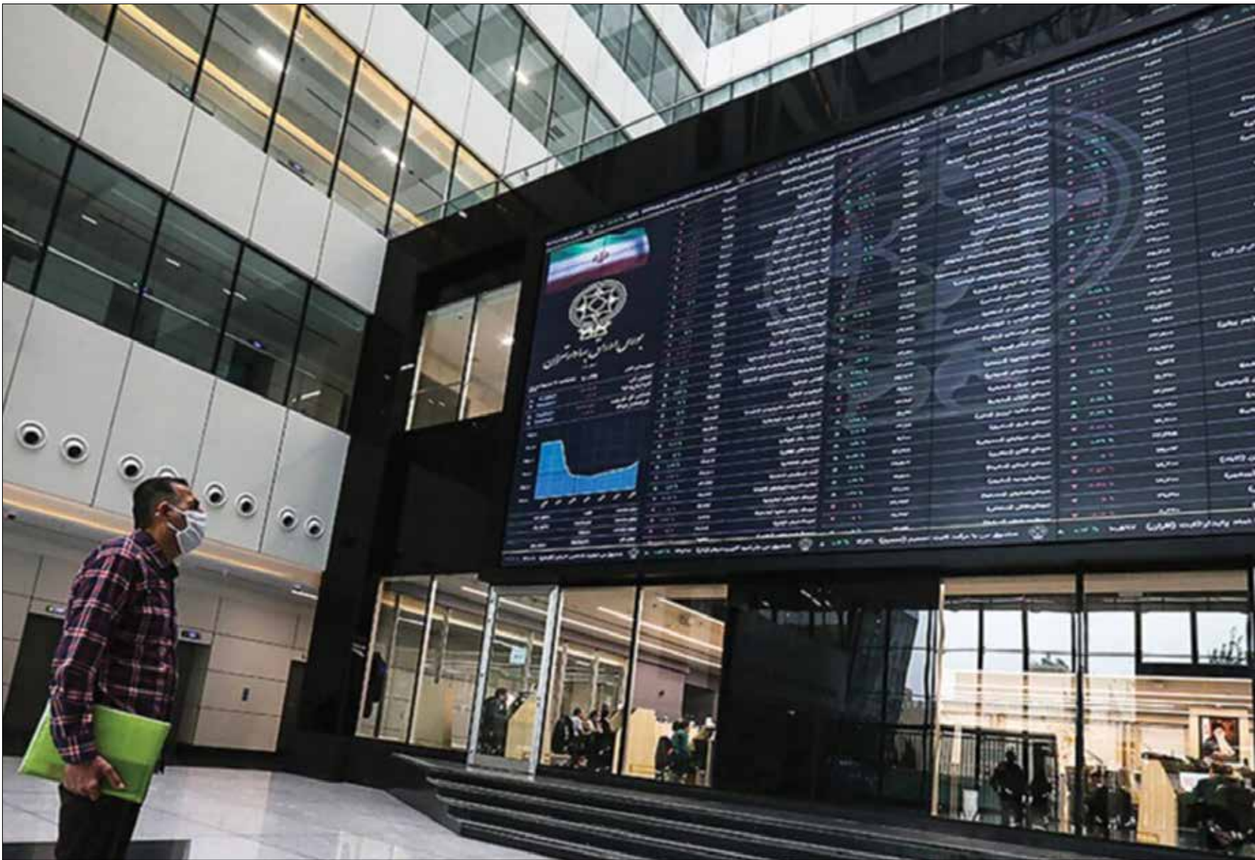
بیش از ۱.۵ میلیون نفر مشارکت کردند