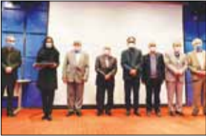
بندرعباس - خبرنگار فرصت امروز روابط عمومی و امور بین الملل شرکت نفت ستاره خلیج فارس با کسب عناوین برتر شانزدهمین جشنواره ملی انتشارات روابط عمومی درخشان. به گزارش روابط عمومی و امور بین الملل شرکت نفت ستاره خلیج فارس، اختتامیه شانزدهمین جشنواره ملی انتشارات روابط عمومی با حضور معاون امور مطبوعاتی و اطلاع رسانی وزارت فرهنگ و ارشاد اسلامی، اعضای انجمن متخصصان روابط عمومی و جمعی از مدیران و کارشناسان روابط عمومی های کشور در محل سالن همایش های سازمان مدیریت صنعتی ایران برگزار شد. در این دوره از جشنواره روابط عمومی و امور بین الملل شرکت نفت ستاره خلیج فارس توانست با کسب عناوین برتر بدرخشد. در اختتامیه این جشنواره ملی به پاس عملکرد شایسته روابط عمومی و امور بین الملل شرکت نفت ستاره خلیج فارس، اختتامیه شانزدهمین جشنواره ملی انتشارات روابط عمومی شرکت اهدا شد. شانزدهمین جشنواره ملی انتشارات روابط عمومی به همت انجمن متخصصان روابط عمومی با همکاری دانشگاهها، روابط عمومی وزارتخانه ها، سازمان ها و شرکتهای خصوصی دولتی در دو بخش رقابتی و آموزشی در دو گروه تهرانی و استانی برگزار شد.

در دیدار مدیرعامل پتروشیمی با دادستان ایلام تأکید شد: