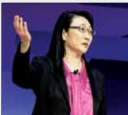
اچ تی سی به دنبال احیای بخش موبایل با فناوری های نوین