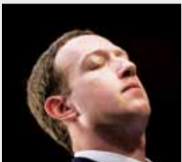
فیس‌بوک پتنتی برای جاسوسی از کاربران به ثبت رسانده است