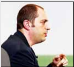
جان کوم، مدیرعامل واتس‌آپ، فیس‌بوک را ترک می‌کند