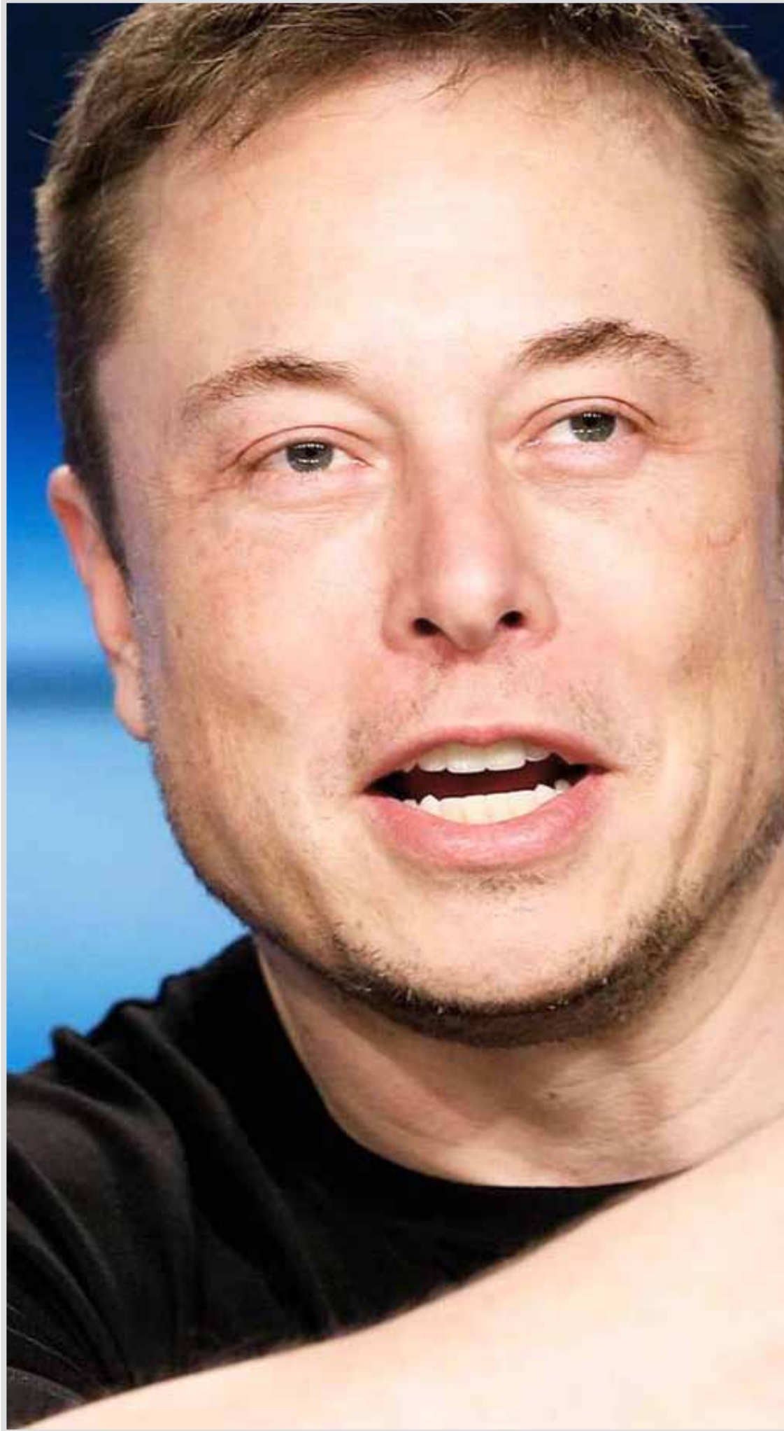
مشاور وزیر کار خبر داد

باز آفرینی شهری رویکردی است که درصدد احیاء و معاصر سازی این محلات سنتی گام برمی‌دارد و تلاش تزریق روحی دوباره در این مناطق و فراهم آوردن شرایطی برای حضور و مشارکت همگان در فرآیند آن، از اهداف ارزشمند این رویکرد است. محرک‌های توسعه باز آفرینی شهری مولدایی هستند در جهت بازگرداندن رونق و توسعه به مناطق مورد پژوهش‌های باز آفرینی شهری تا چرخه فعالیت زنده و پویا را در این مناطق به راه اندازد. در همین راستا چگونگی تأثیر رویکرد محرک توسعه در فرآیند باز آفرینی شهری در محلات سنتی ضروری است. (رویکرد نو در باز آفرینی اقتصادی شهری). مهم‌ترین عامل فرسودگی بافت‌های شهری، افت اقتصادی است. این باعث می‌شود بخش‌هایی از شهر از چرخه حیات شهری خارج شوند و رو به مُردگی