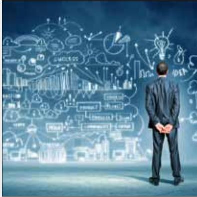
معاون وزیر علوم: