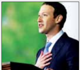
متن شهادت‌نامه‌زا کرپرگ در برابر کنگره آمریکامنتشر شد