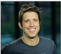
گوپرو در صدد جلب مشتری برای فروش خود است