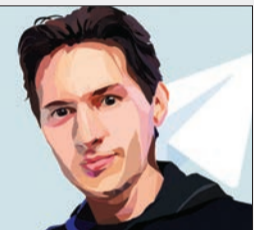
راهاندازی دفتر تلگرام در دوبئی